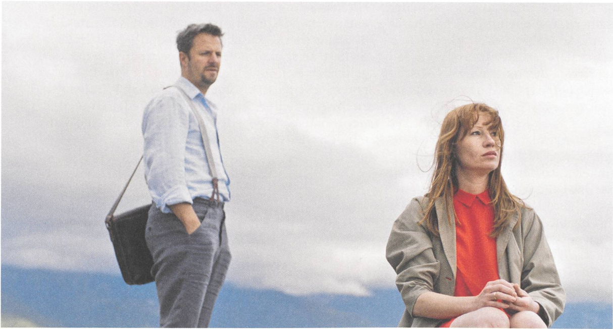
Tiere Philipp Hochmair und Birgit Minichmayr