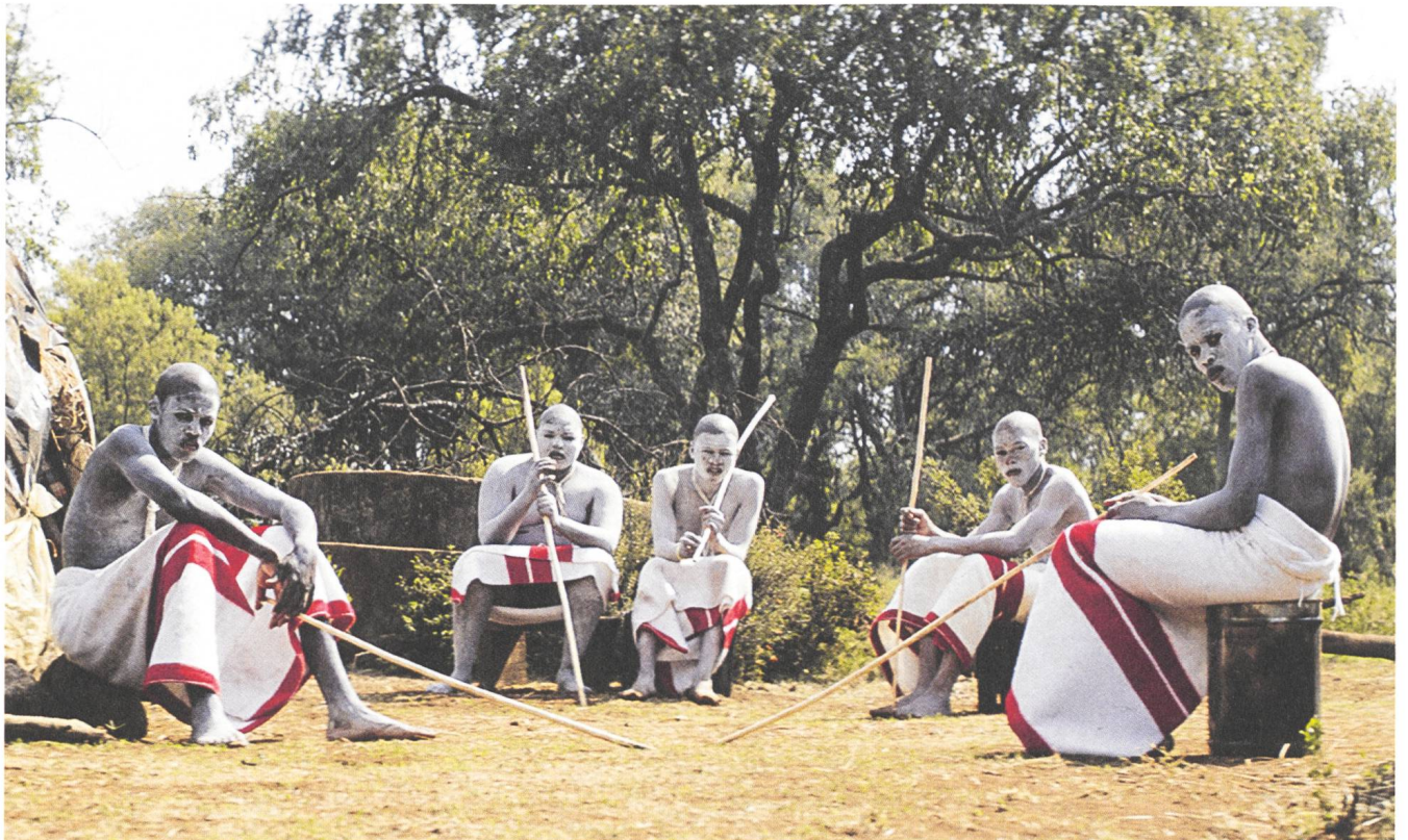
The Wound / Inxeba Regie: John Trengove