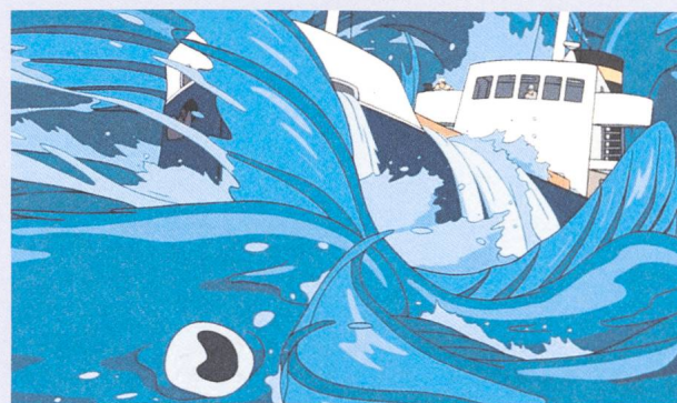
Ponyo (2008) Regie: Hayao Miyazaki

Animationsindustrie beherrscht, seit Walt Disney den Zeichentrickfilm mit naturalistischer Detailtreue zu einem ernst zu nehmenden Medium erheben wollte. Bezüglich Naturdarstellungen orientiert sich das Disney-Studio im Prinzip bis heute am selben romantischen Illustrationsideal des 19. Jahrhunderts wie bei Snow White (Dave Hand, 1937). Verändert haben sich nur die Werkzeuge: So lassen sich die physikalischen Eigenschaften von Wasser mittlerweile im Computer simulieren. Da jedoch auch realistisch wirkende Spezialeffekte nie die Wirklichkeit abbilden, sondern primär ästhetische und dramaturgische Vorgaben erfüllen sollen, müssen die Animatoren möglichst viele Parameter einer Wassersimulation kontrollieren können. Für Moana wurde diese Technik so weit perfektioniert, dass die Wellen des Pazifiks zwar natürlich wirken, sich aber gleichzeitig wie eine Figur bewegen lassen.