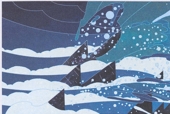
Zwischen den Elementen

Im Vergleich dazu verzichtete Hayao Miyazaki in Ponyo bewusst auf solch digitale Spezialeffekte, wie er sie etwa bei der Animation des wandelnden Schlosses in Howl's Moving Castle (2004) einsetzte. Mit der Geschichte um das Goldfischmädchen Ponyo, das einem Menschenjungen an Land folgt, ist er zum kindlichen Charme seiner frühen Filme zurückgekehrt.