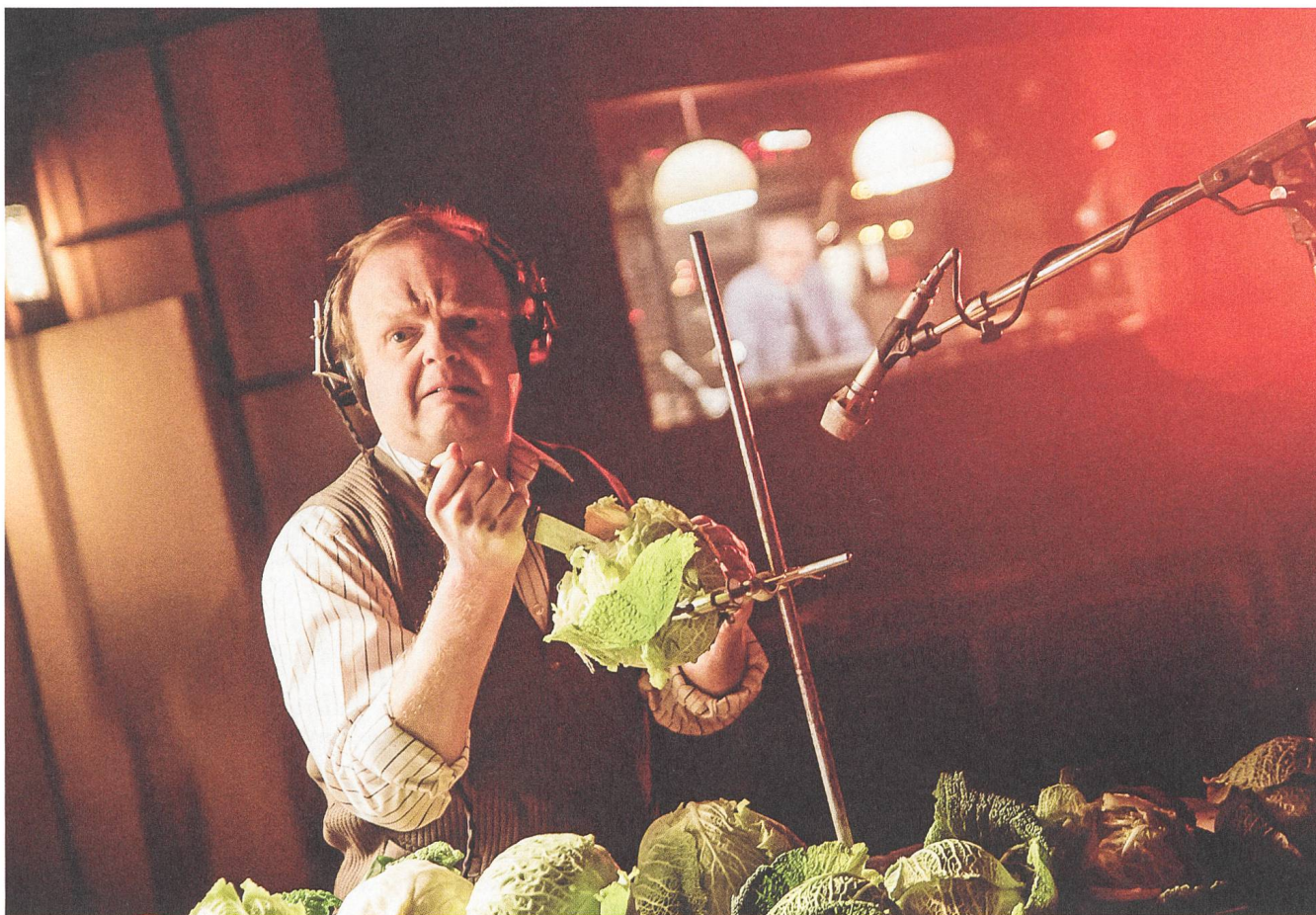
Berberian Sound Studio (2012). Regie: Peter Strickland, mit Toby Jones

Verlag Filmbulletin Dienerstrasse 16 CH-8004 Zürich +41 52 226 05 55 info@filmbulletin.ch www.filmbulletin.ch