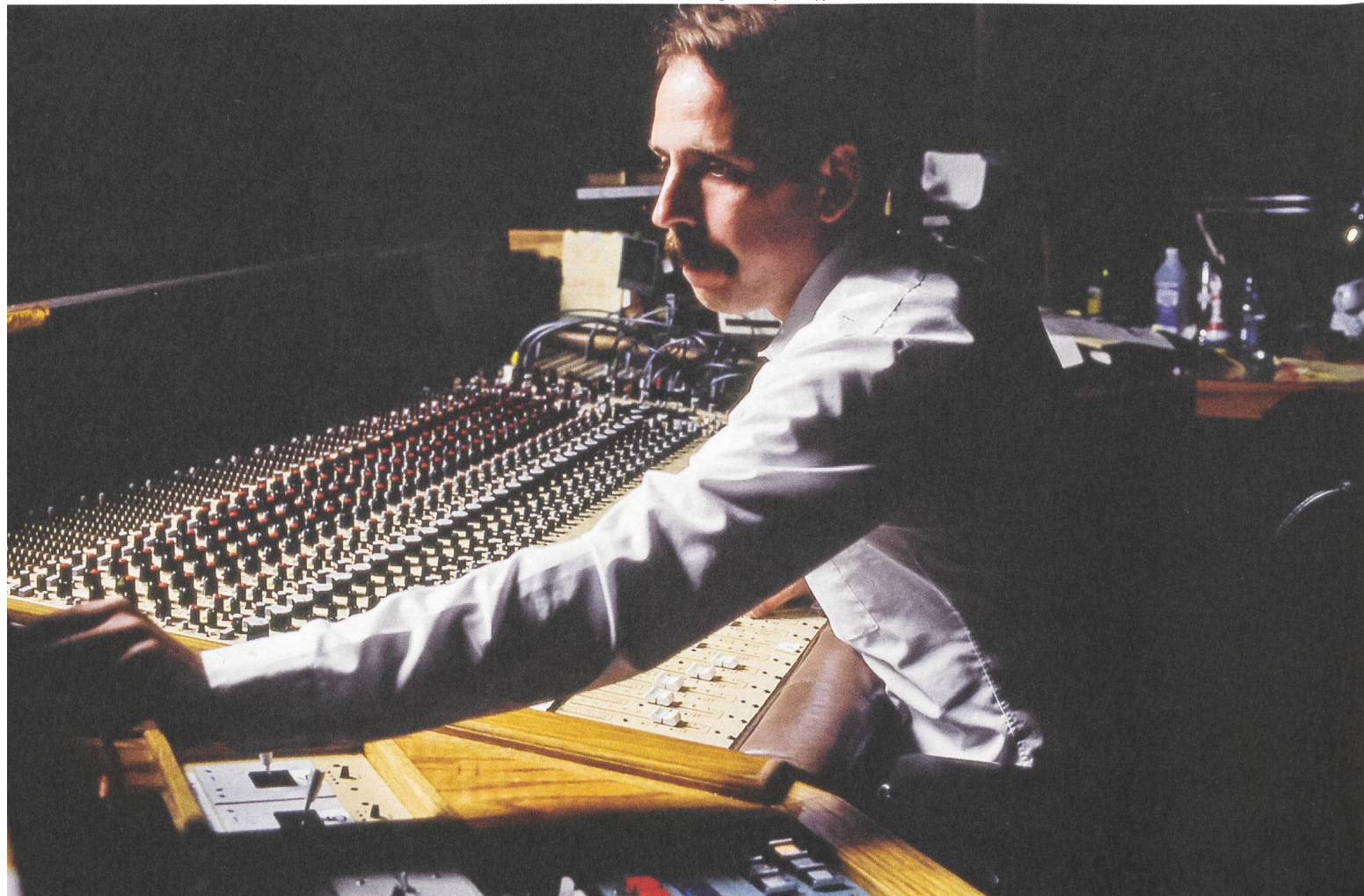
Walter Murch bei der Tonmischung von Apocalypse Now (1979)