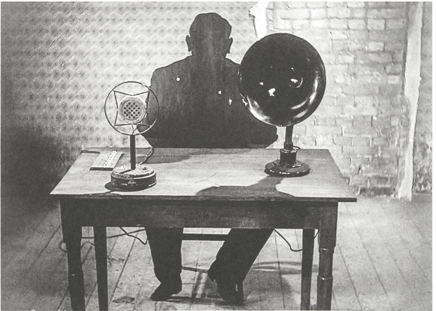
Das Testament des Dr. Mabuse (1933) Regie: Fritz Lang