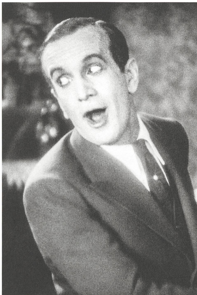
The Jazz Singer (1927) mit Al Jolson