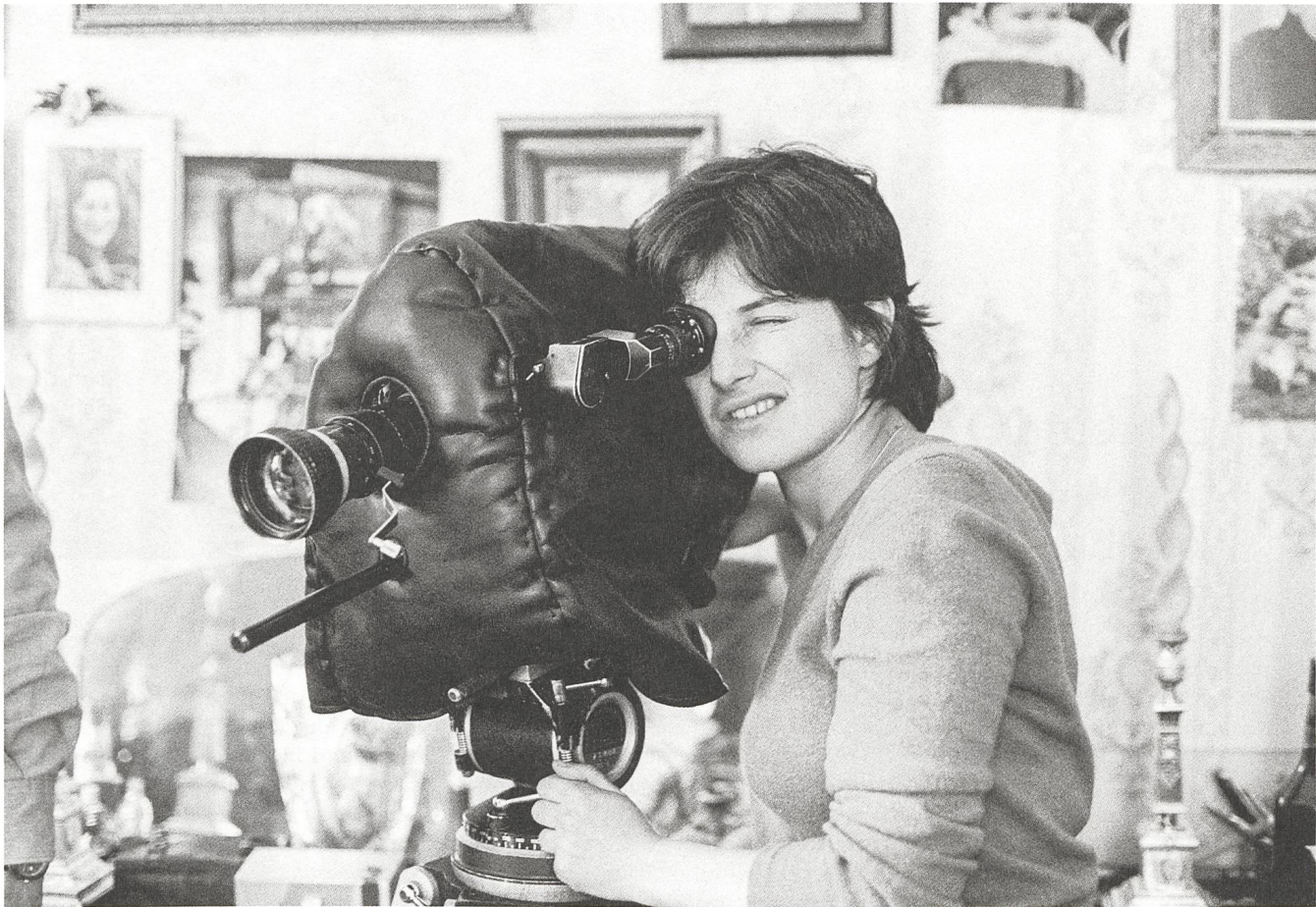
Chantal Akerman bei den Dreharbeiten zu Dis-moi (1980)

Verlag Filmbulletin Dienerstrasse 16 CH-8004 Zürich +41 52 226 05 55 info@filmbulletin.ch www.filmbulletin.ch