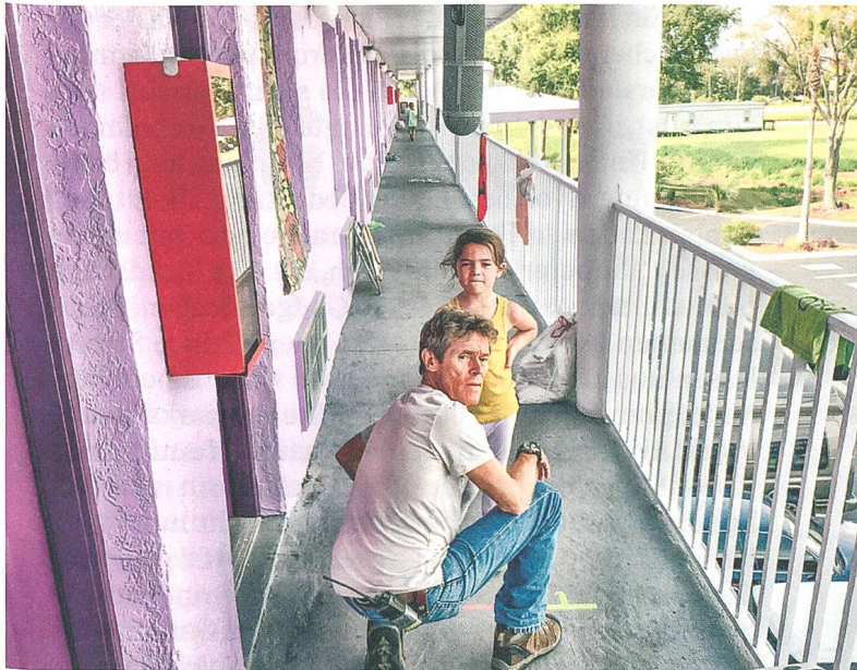
The Florida Project Willem Dafoe und Brooklynn Prince