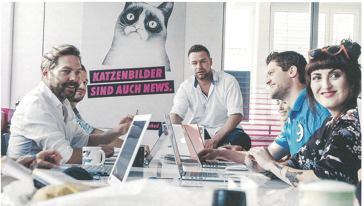
Die vierte Gewalt Regie: Dieter Fahrer