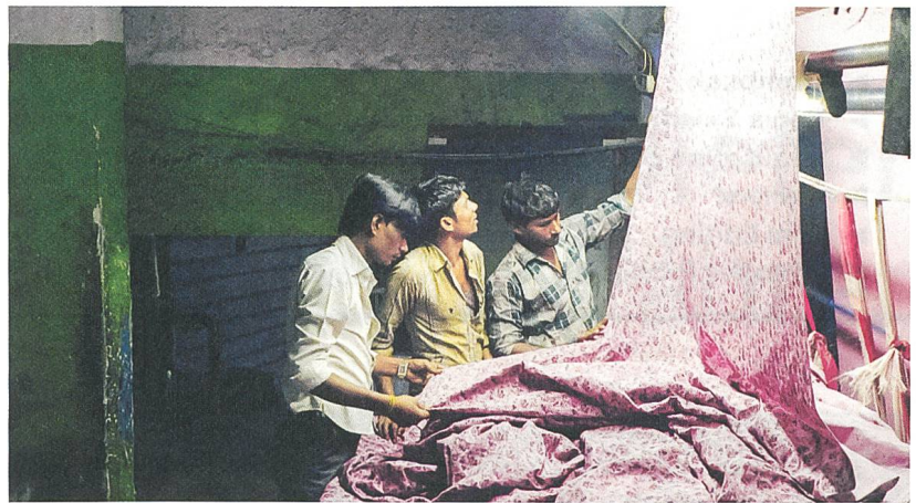
Machines Regie: Rahul Jain