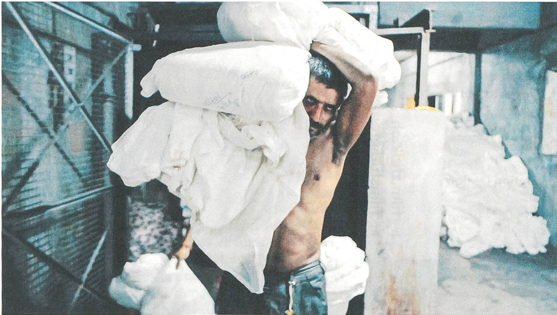
Machines Regie: Rahul Jain