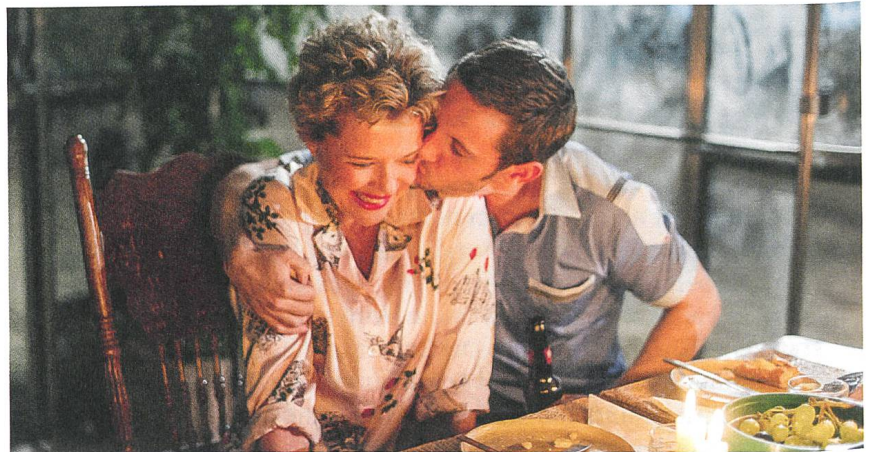
Film Stars Don't Die in Liverpool Annette Bening und Jamie Bell