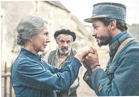
Les gardiennes Regie: Xavier Beauvois