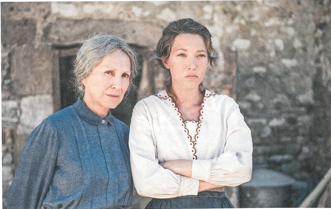
Les gardiennes Nathalie Baye und Laura Smet