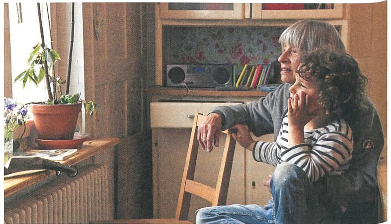
Apfel und Vulkan