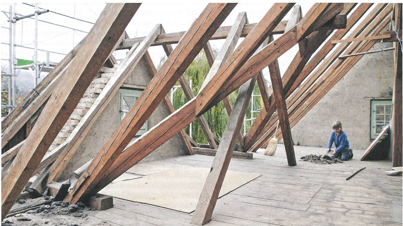
Apfel und Vulkan Regie: Nathalie Oestreicher