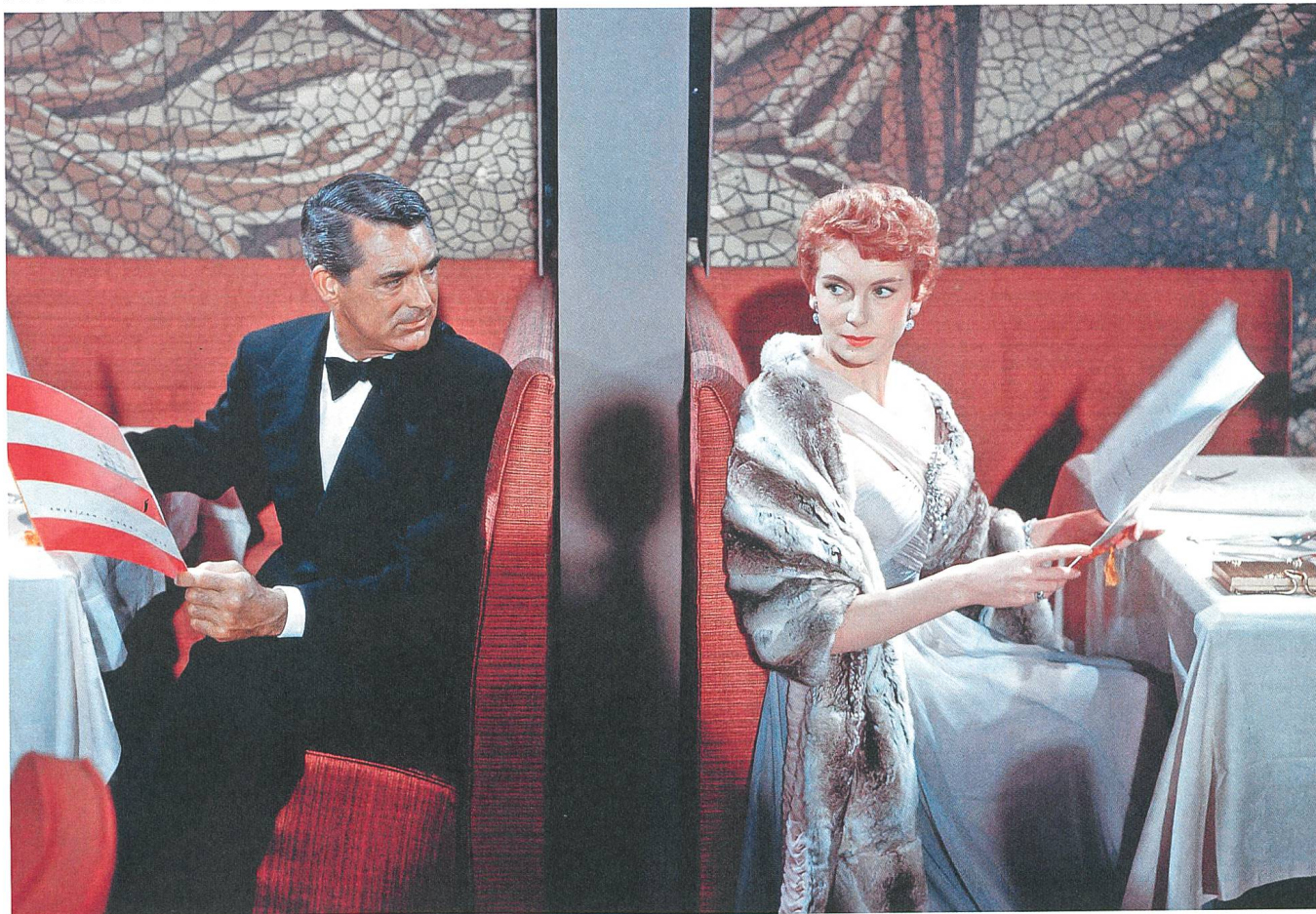
An Affair to Remember. Regie: Leo McCarey, mit Cary Grant und Deborah Kerr