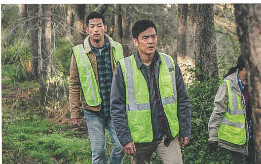
Searching mit Joseph Lee und John Cho