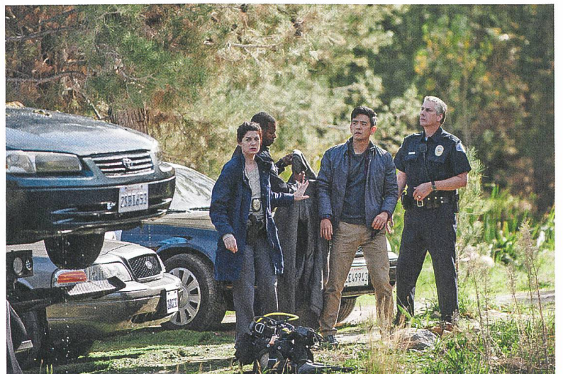
Searching Regie: Aneesh Chaganty, mit Debra Messing und John Cho