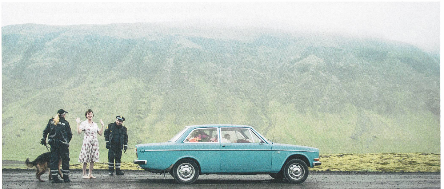
Woman at War Regie: Benedikt Erlingsson