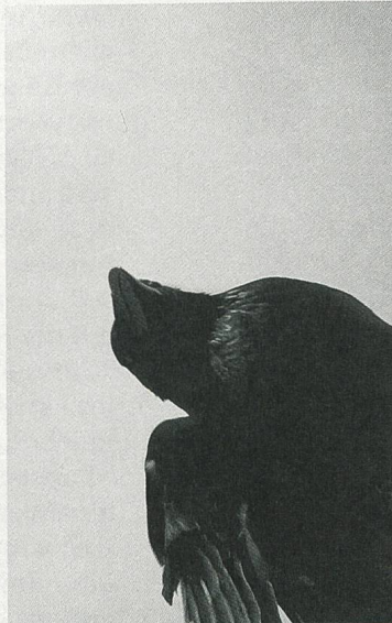
Krähen schiessen Regie: Christine Hürzeler

Das Auswahlverfahren in Leipzig ist individueller und mehrstufig. Wer welche Filme vorsichtet, erfolgt nach einem Zufallsprinzip. Wie alle anderen auch, habe ich im Vorfeld nicht alle Einreichungen gesehen und muss damit umgehen, dass da allenfalls noch ein Film dabei gewesen wäre, der mich überzeugt hätte. Jeder Film hat