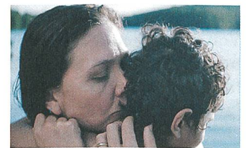
The Kindergarten Teacher