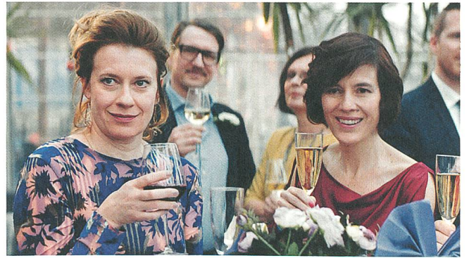
Womit haben wir das verdient? Regie: Eva Spreitzhofer