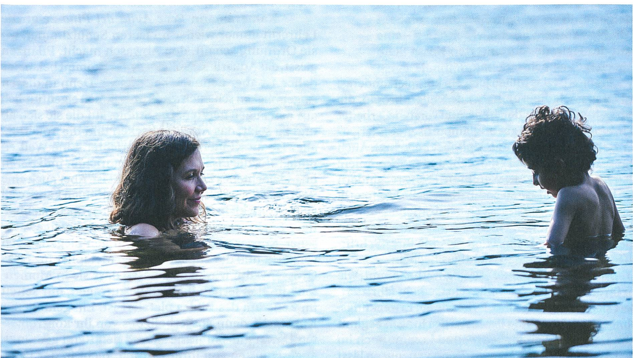
The Kindergarten Teacher Regie: Sara Colangelo, mit Maggie Gyllenhaal und Parker Sevar