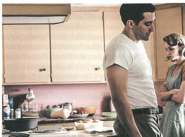
Wildlife Regie: Paul Dano