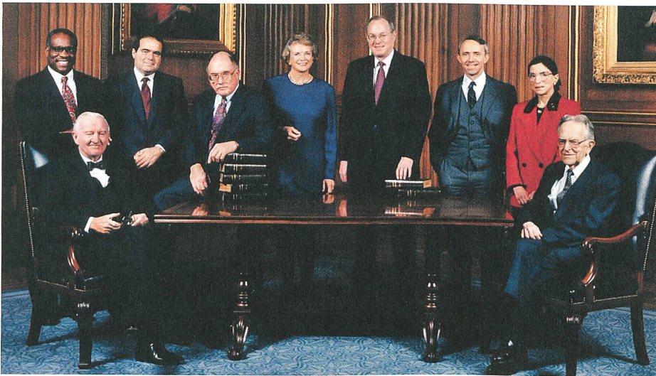
RBG Bader Ginsberg (in rot) im Supreme Court