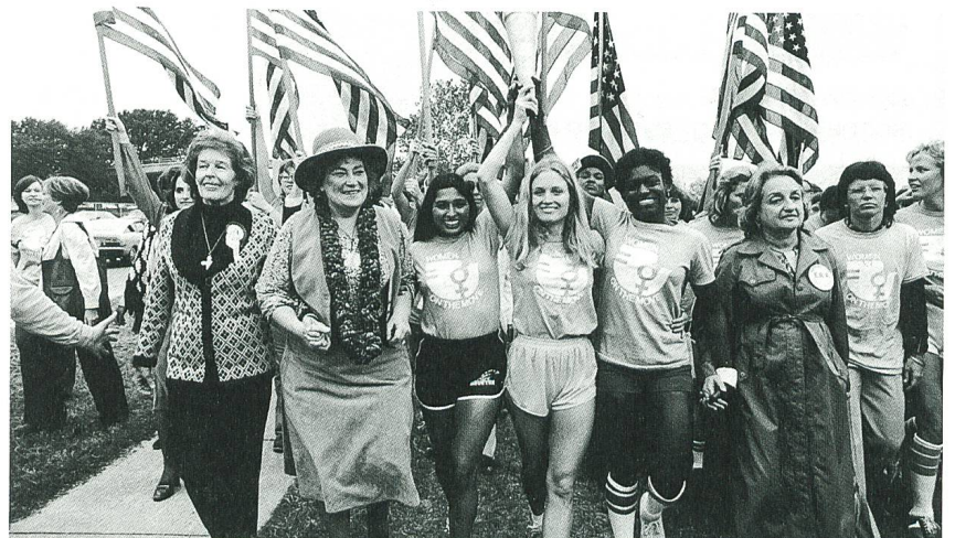
RBG Regie: Betsy West, Julie Cohen