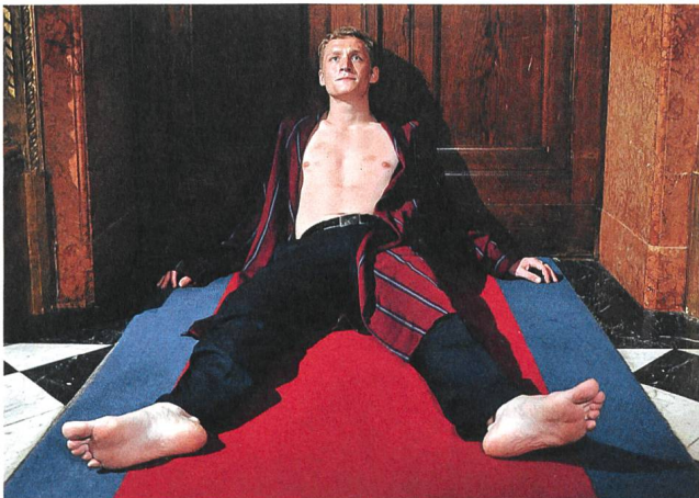
Tatort: Weil sie böse sind (2010) Regie: Florian Schwarz