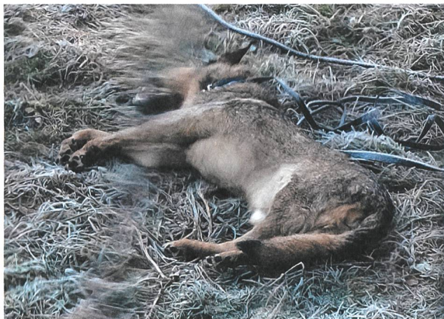
Polizeiruf 110: Wölfe (2016) Regie: Christian Petzold