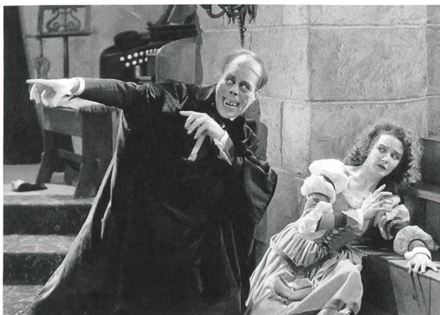
The Phantom of the Opera (1925) Regie: Rupert Julian