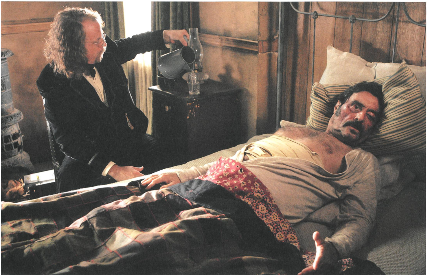
Deadwood mit Ian McShane, Brad Dourif