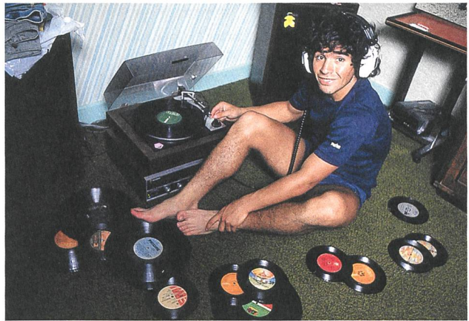
Diego Maradona