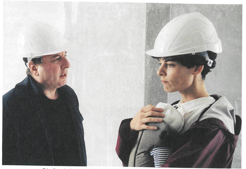
Die fruchtbaren Jahre sind vorbei Regie: Natascha Beller