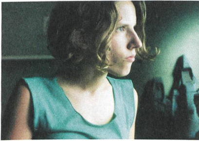
Familia sumergida mit la Arteta