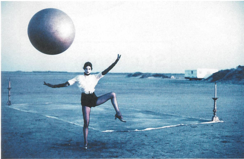
Peter Lindbergh – Women's Stories Regie: Jean-Michel Vecchiet