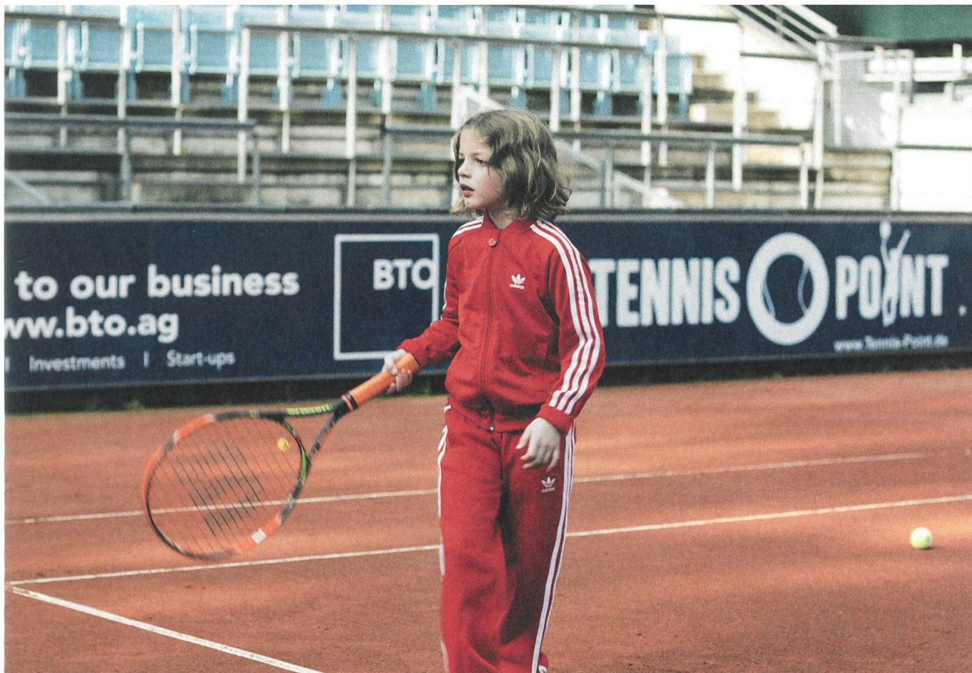
Ich war zuhause, aber... Regie: Angela Schanelec

Verlag Filmbulletin Diererstrasse 16 CH-8004 Zürich +41 52 226 05 55 info@filmbulletin.ch www.filmbulletin.ch