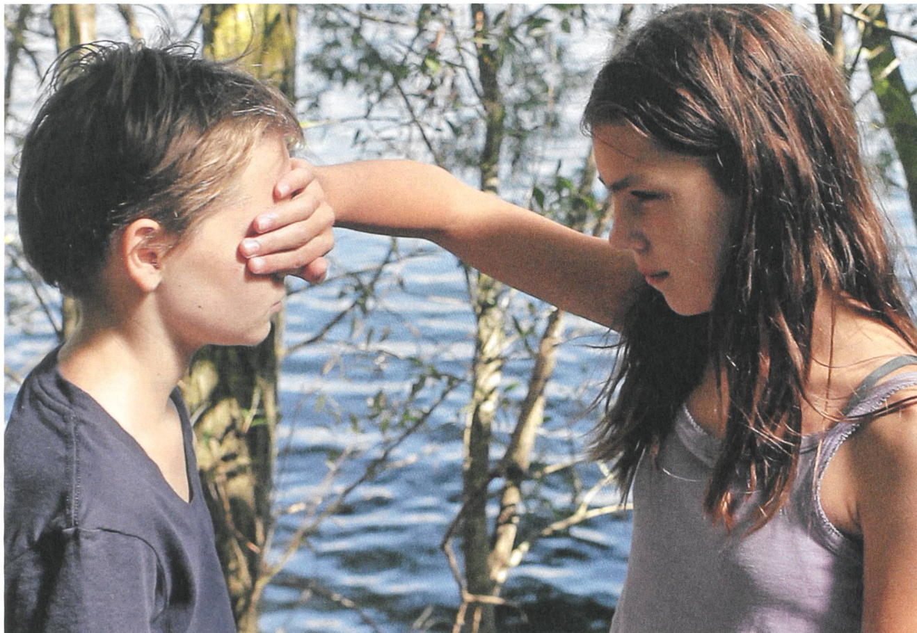
Tomboy (2011) Regie: Céline Sciamma

Verlag Filmbulletin Diererstrasse 16 CH-8004 Zürich +41 52 226 05 55 info@filmbulletin.ch www.filmbulletin.ch