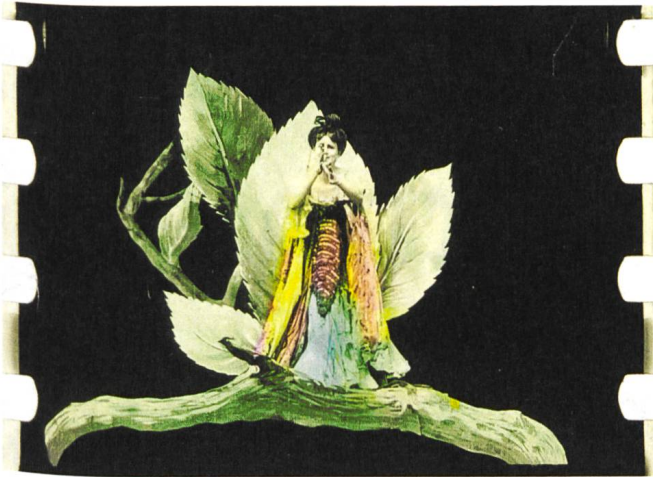
Métamorphoses du papillon (1904) Gaston Velle