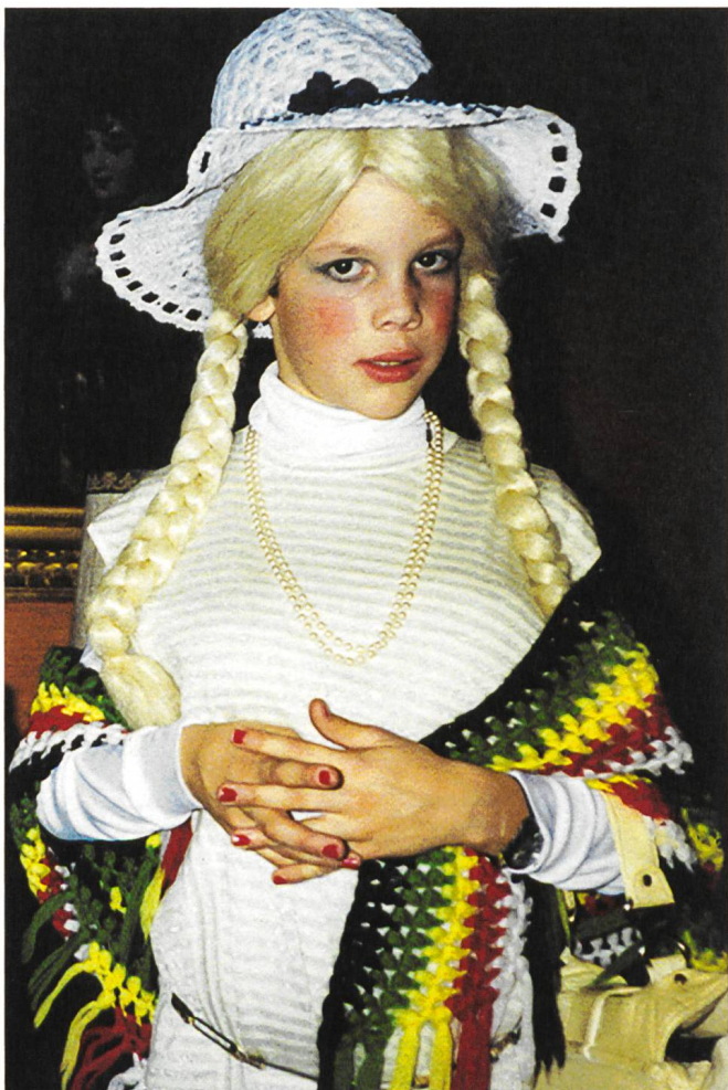
Madame (2019) Regie: Stéphane Riethauser