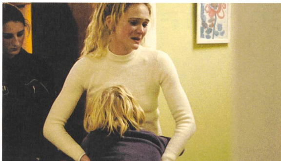
Systemsprenger Regie: Nora Fingscheidt