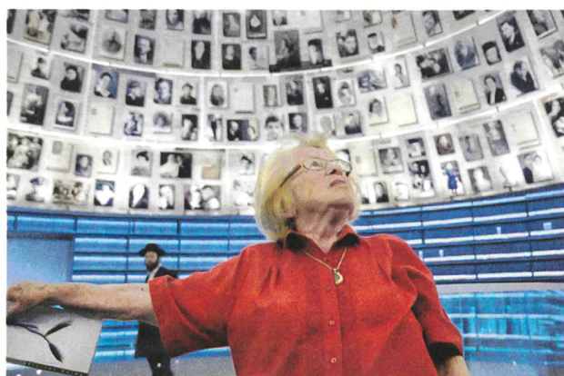
Ask Dr. Ruth mit Dr. Ruth Westheimer