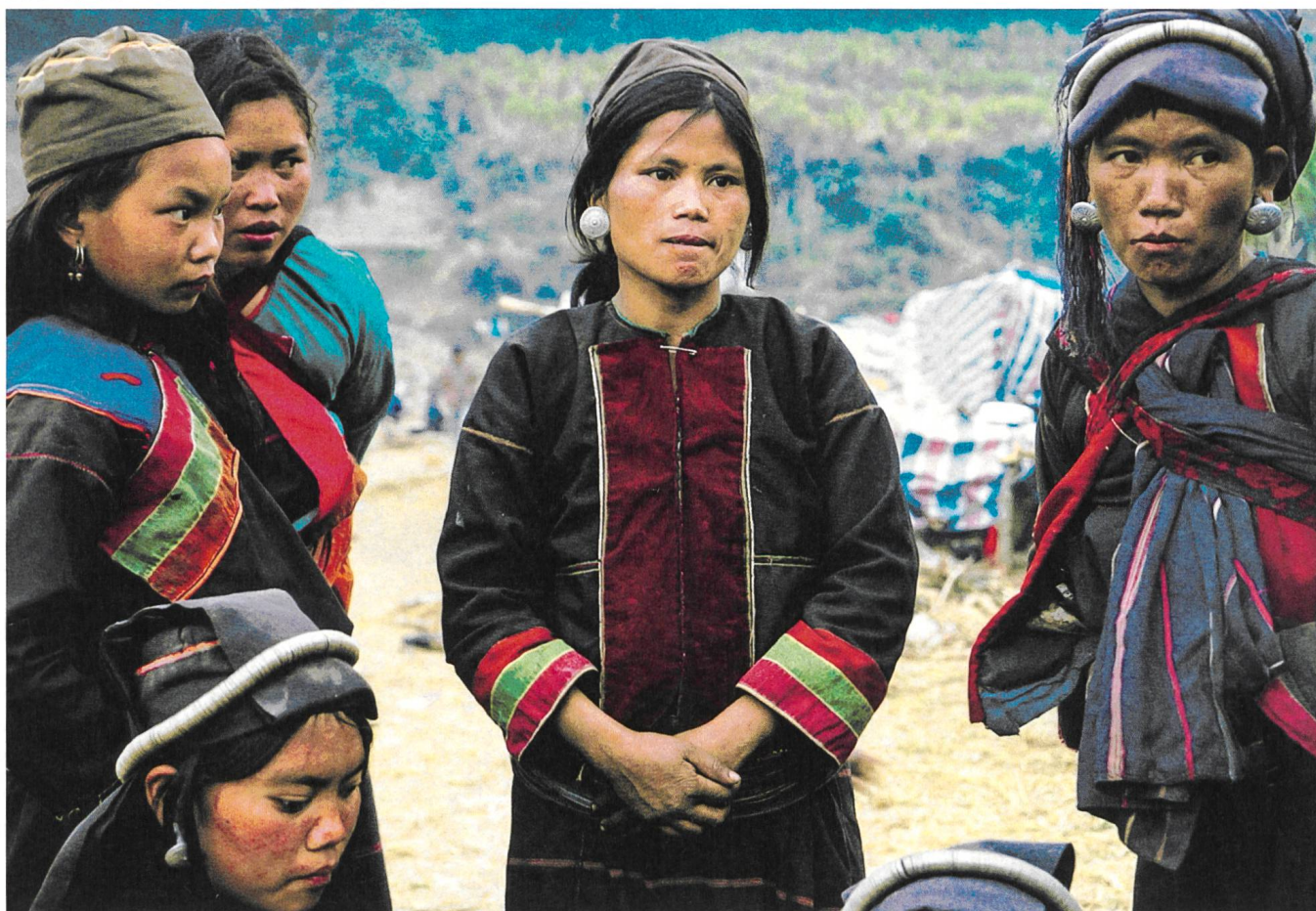
Ta'ang (2016) Regie: Wang Bing

Verlag Filmbulletin Diensterstrasse 16 CH-8004 Zürich +41 52 226 05 55 info@filmbulletin.ch www.filmbulletin.ch