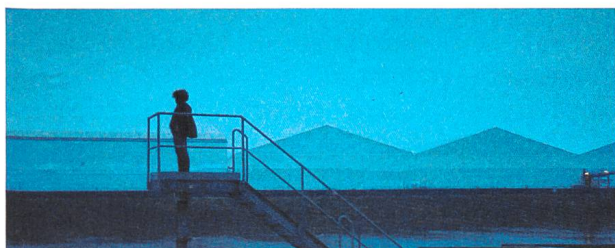
Where We Belong Kamera: Nikolai von Graevenitz