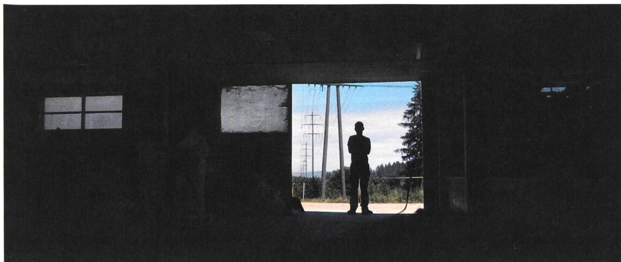
Where We Belong Schnitt: Gion-Reto Killias