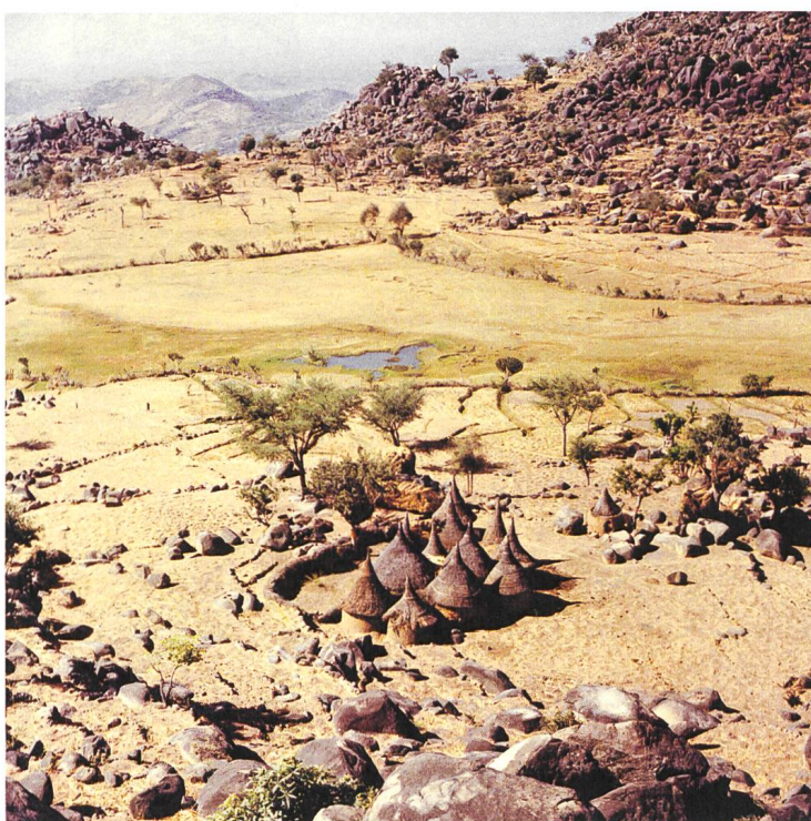
African Mirror Regie: Mischa Hedinger