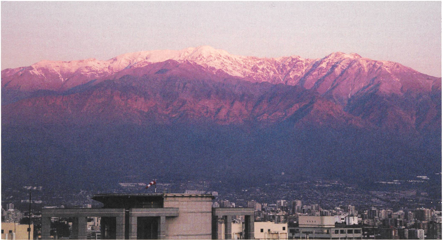
La cordillera de los sueños Regie: Patricio Guzmán