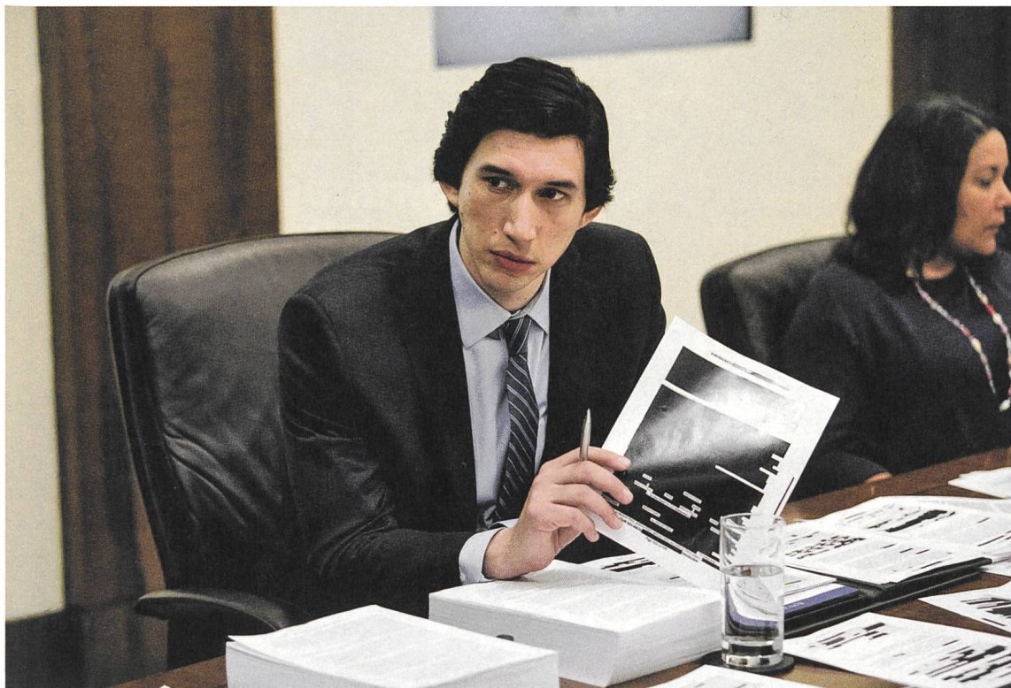
The Report mit Adam Driver