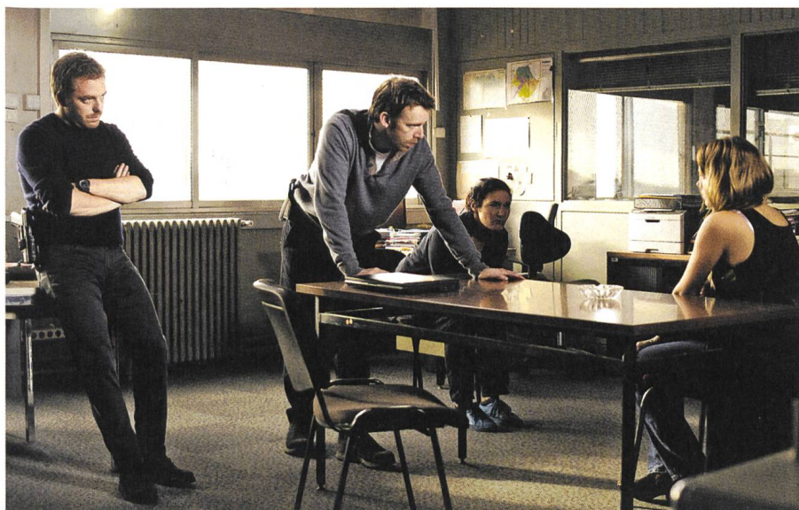
Roubaix, une lumière Regie: Arnaud Desplechin