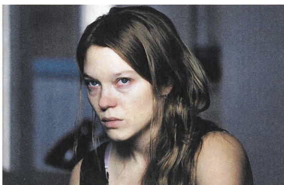
Roubaix, une lumière Regie: Léa Seydoux