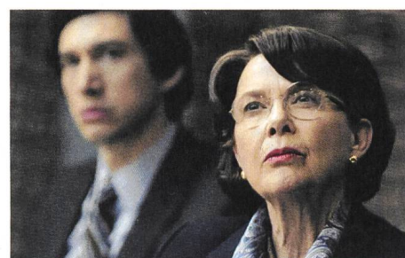
The Report Regie: Scott Z. Burns