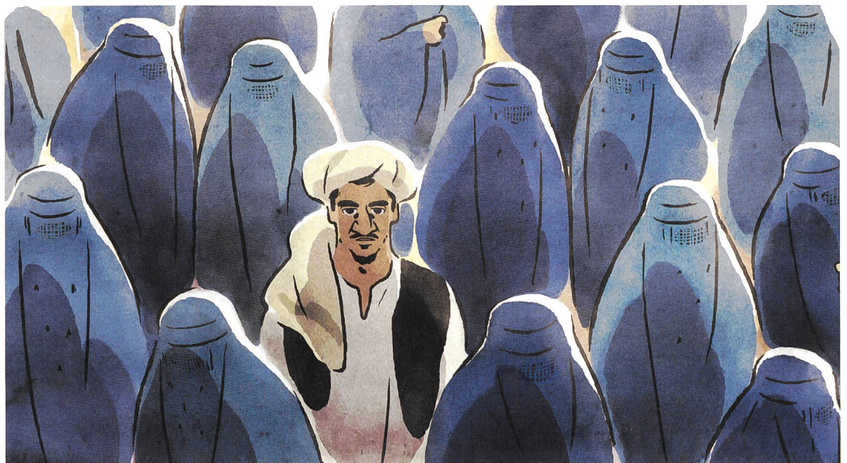
Les hirondelles de Kaboul Musik: Alexis Rault