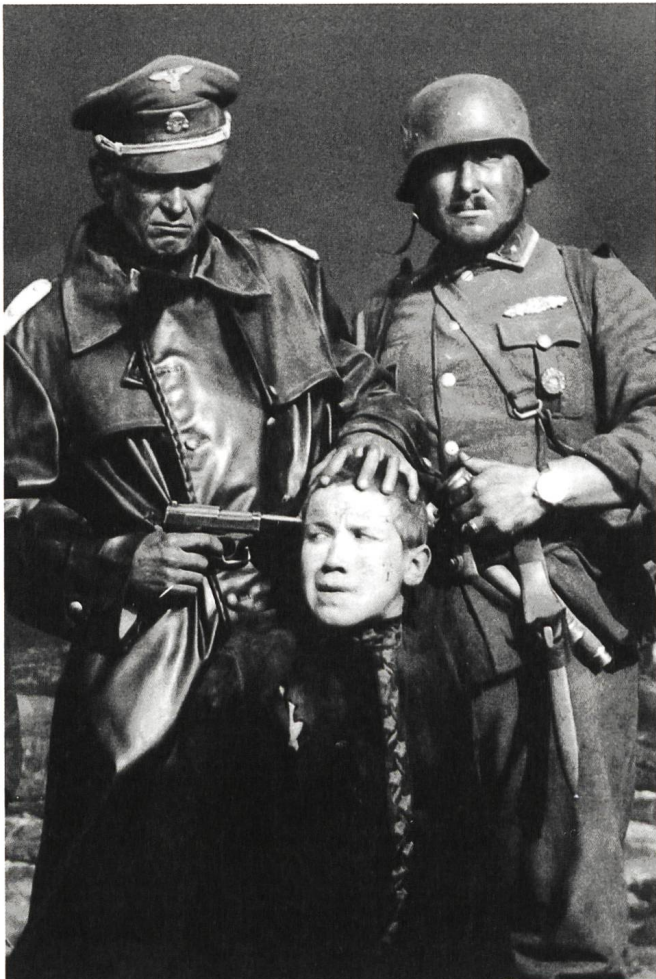
Idi i smotri (1985) Regie: Elem Klimow