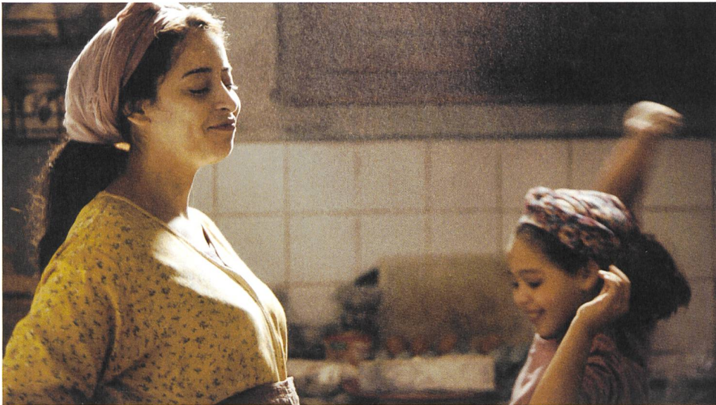
Adam Regie: Maryam Touzani