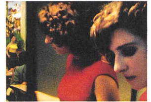
The Invisible Life of Eurídice Gusmão