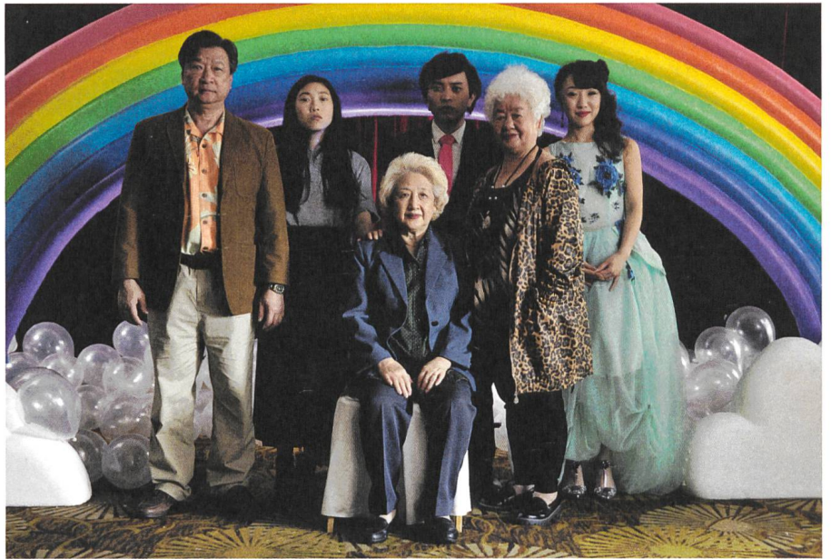
The Farewell Regie: Lulu Wang