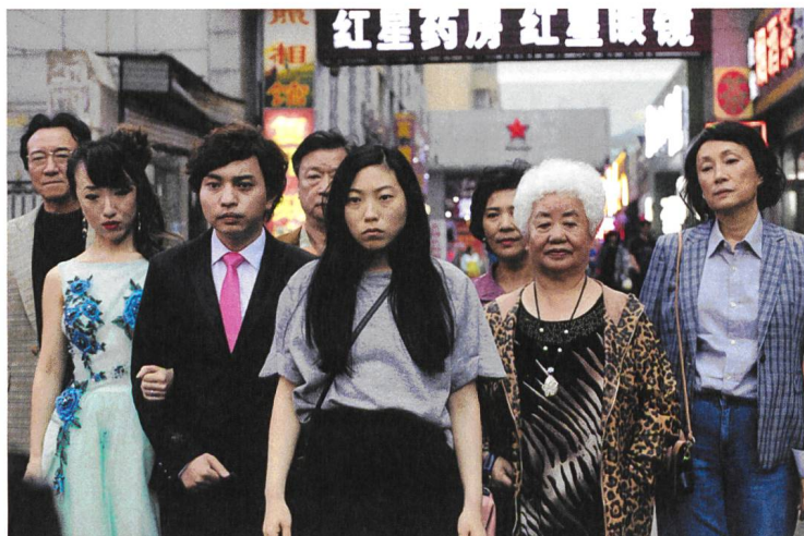
The Farewell mit Awkwafina als Billi (Mitte)