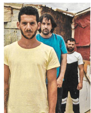
Entre dos Aguas Kamera: Diego Dussuel