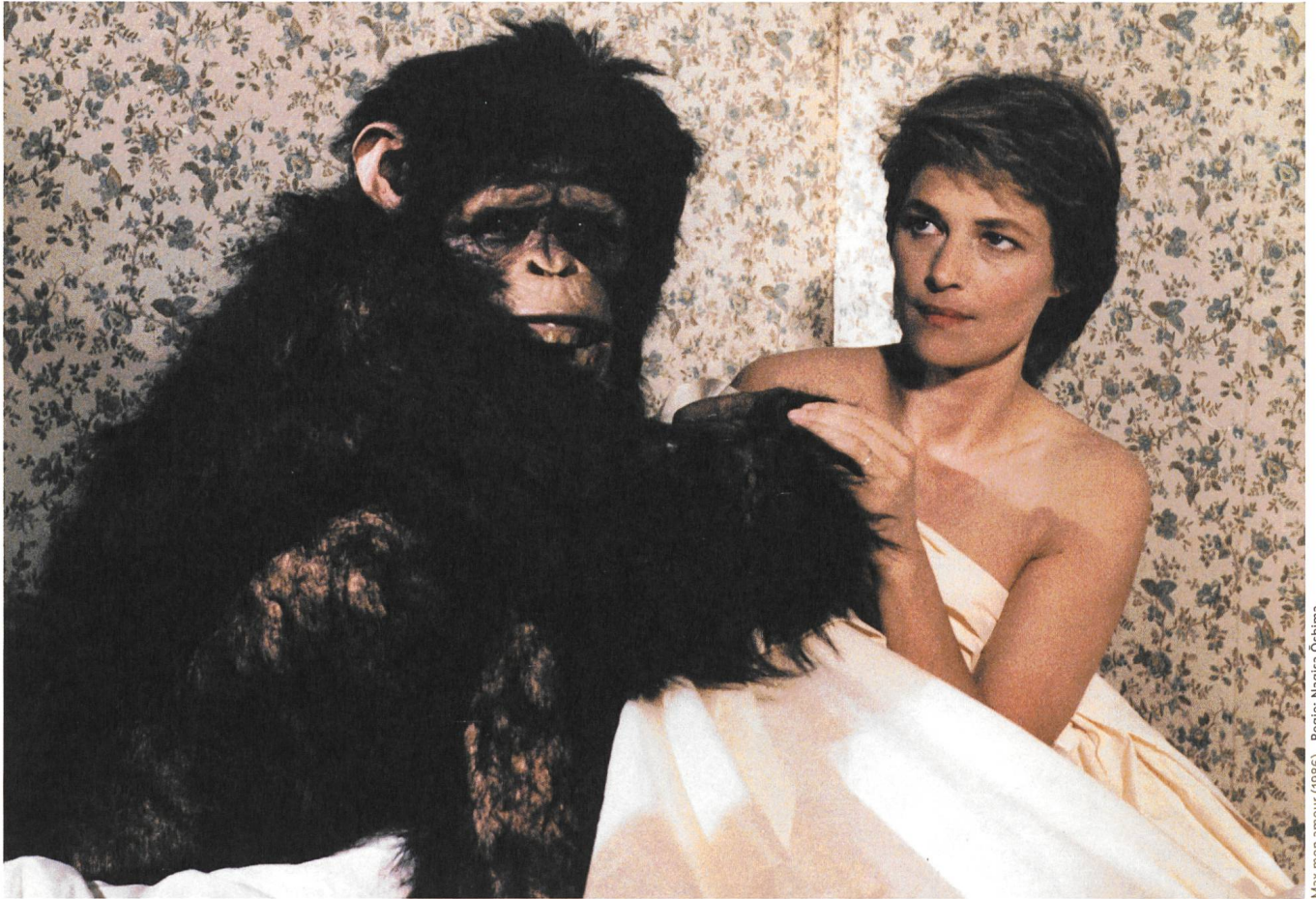
Max mon amour (1986) Regie: Nagisa Oshima

Verlag Filmbulletin Dienersstrasse 16 CH-8004 Zürich +41 52 226 05 55 info@filmbulletin.ch www.filmbulletin.ch