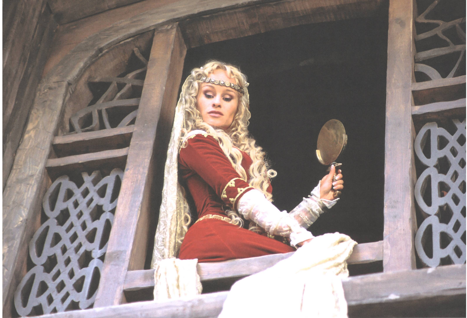
Siegfried (2005) Regie: Sven Unterwaldt