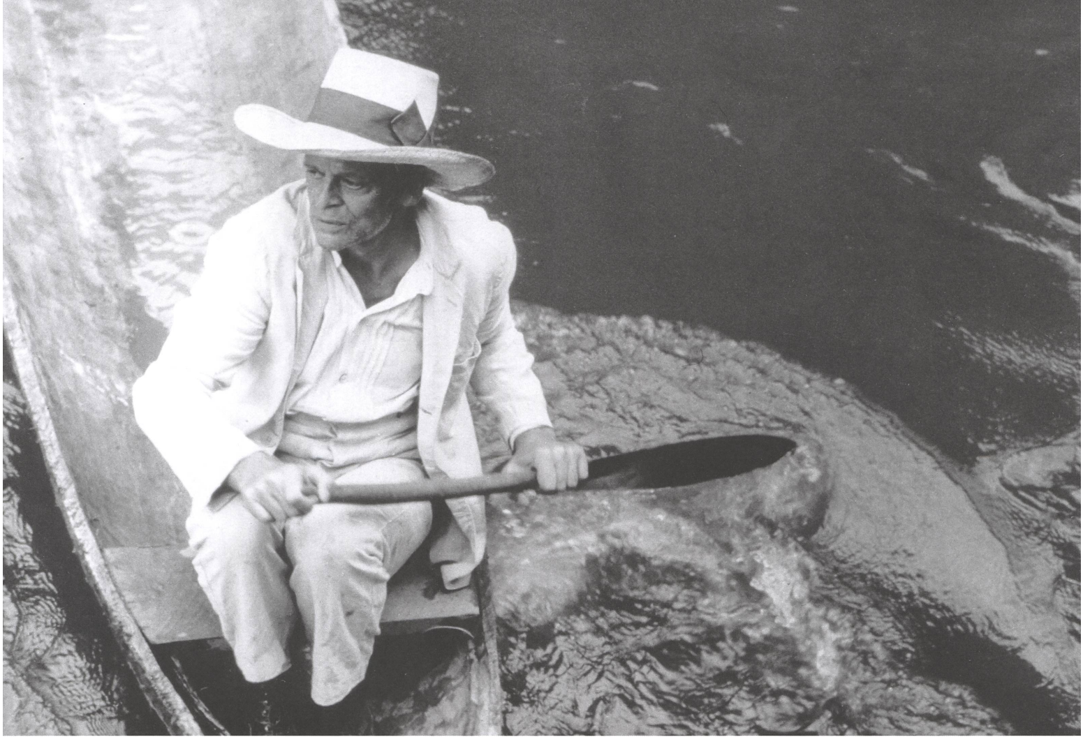
Fitzcarraldo (1982) mit Klaus Kinski