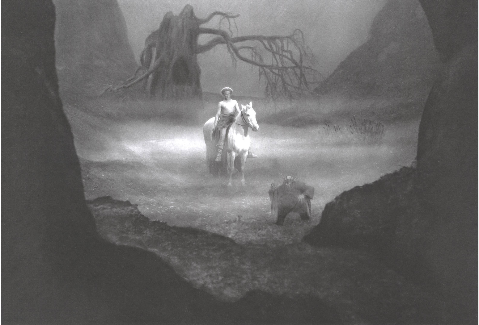
Die Nibelungen (1924) Regie: Fritz Lang