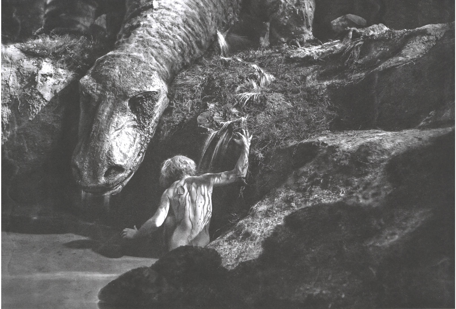
Die Nibelungen (1924) Drehbuch: Thea von Harbou