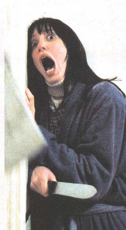
Shining (1980) mit Shelley Duvall

Manchmal wird mit dem Mythos dann auch bewusst gespielt, etwa als behauptet wurde, dass Shia LaBeouf auf dem Set von Lawless nach einem Streit mit Tom Hardy diesen verprügelt habe. Die Neuigkeiten waren nur schwer zu glauben, denn 2011 war