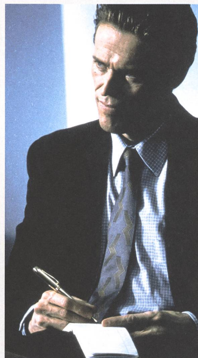
American Psycho (2000) Regie: Mary Harron

Form des Diskurses zum Film. Dass einer der Farrelly -Brüder beim Dreh von There's Something About Mary gerne – wohl als Scherz gemeint – die Hosen runterliess, am liebsten auch vor den Augen von Cameron Diaz , die, so vermute ich, an den jeweiligen Tagen bestimmt nicht ans Set gekommen ist, um die blanke Rückseite des Regisseurs zu sehen, ist im besten Fall unprofessionell. Dass die Anekdote aber in die Mythologie des Films eingegangen ist, hilft, unsere Positionen zu solchen Sachen zu verhandeln. Trivia können aber durchaus auch positiv stimmen, geradezu mood regulating sein; dank ihnen wissen wir etwa, wem wir unsere Lieblingsszenen und -requisiten zu verdanken haben: Der grossartige Gene Wilder habe sich seinen spektakulären Auftritt als Wonka in Willy Wonka & the Chocolate Factory selbst ausgedacht, Jeff Bridges' schäbige Gummisandalen, die so gut zu seinem bekifften «Dude» in The Big Lebowski passen, waren vormals sein Privatbesitz.