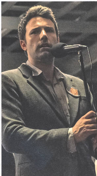
Gone Girl (2014) Regie: David Fincher

Nochmals American Psycho : Haben Sie gewusst, dass Gloria Steinem angeblich persönlich dafür gesorgt habe, dass nicht Leonardo DiCaprio die Hauptrolle übernimmt, weil seine Fangemeinde damals hauptsächlich aus jungen Frauen bestand und Steinem American Psycho nicht für die richtige Kost dieser Zielgruppe hielt? Später soll DiCaprio übrigens in der Szene in Django Unchained , in der er als Südstaaten-«Gent» und Sklavenbesitzer Monsieur Candie einen