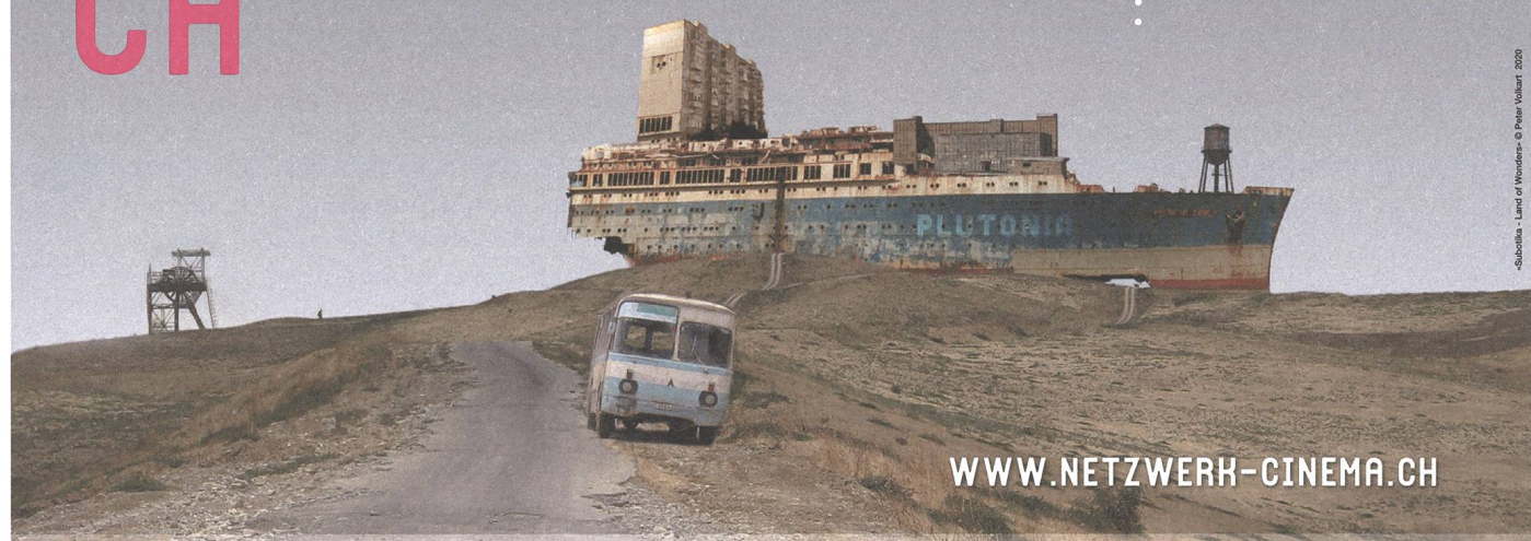
«Subotika - Land of Wonders»

FILM STUDIEREN AUF MASTER- UND DOKTORATSSTUFE · FILMWISSENSCHAFT · FILMREALISATION