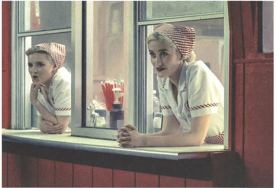
I'm Thinking of Ending Things Regie: Charlie Kaufman