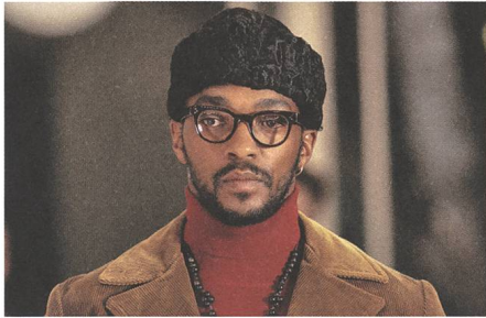
Seberg Musik: Jed Kurzel