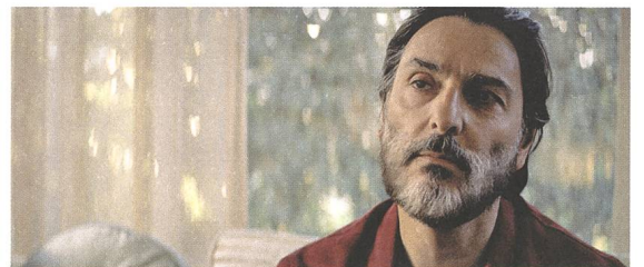
Seberg Buch: Joe Sharpnel, Anna Waterhouse