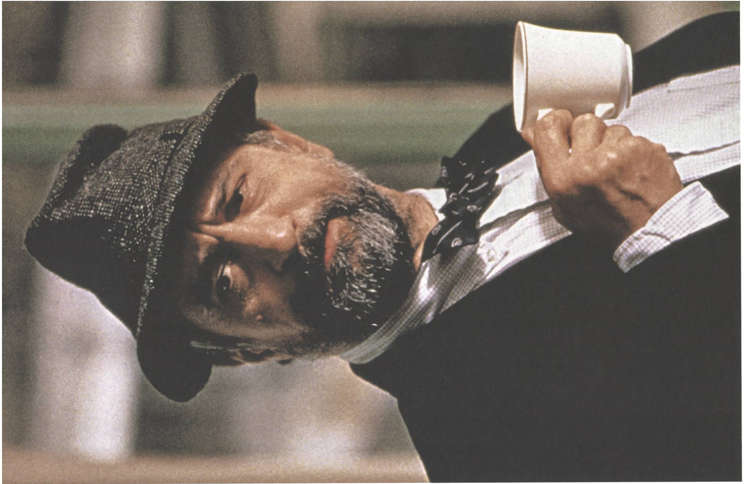
Wag the Dog (1997) Regie: Barry Levinson