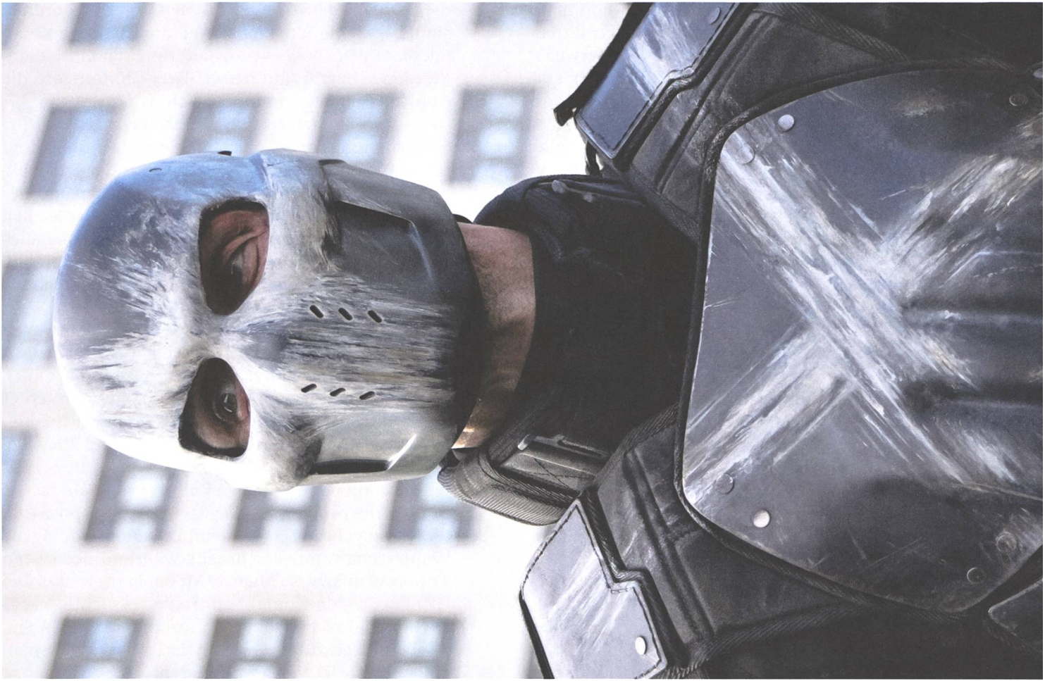
Captain America: Civil War (2016) Regie: Anthony Russo, Joe Russo