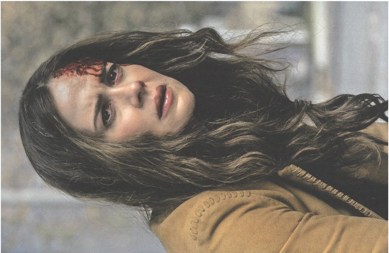
Bird Box (2018) mit Sarah Paulson