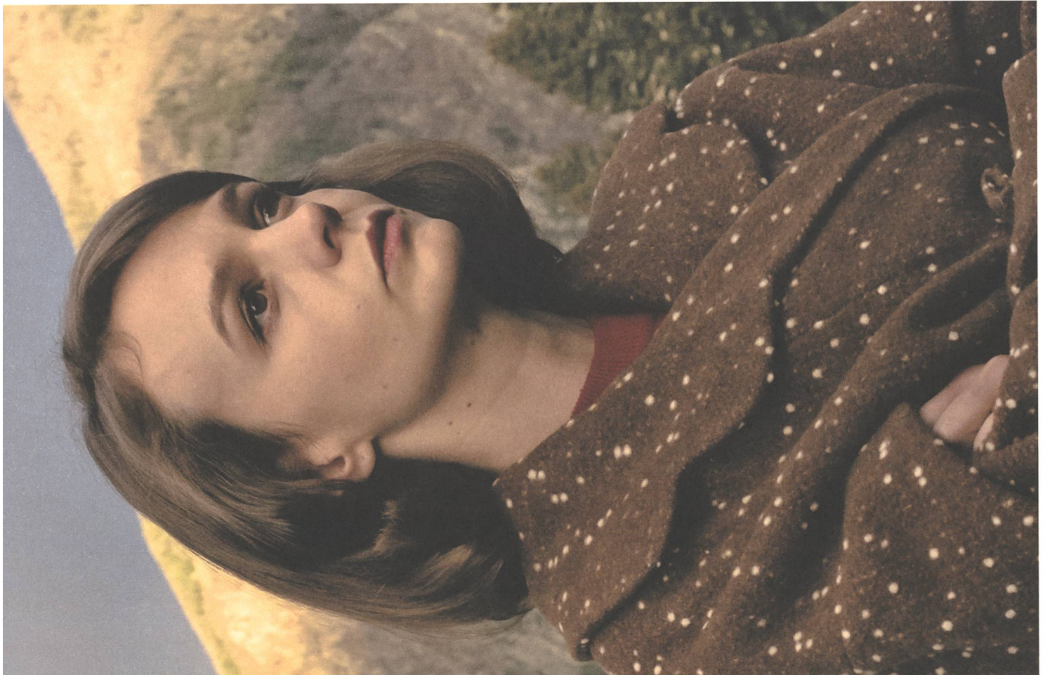
Wildlife (2018) Regie: Paul Dano