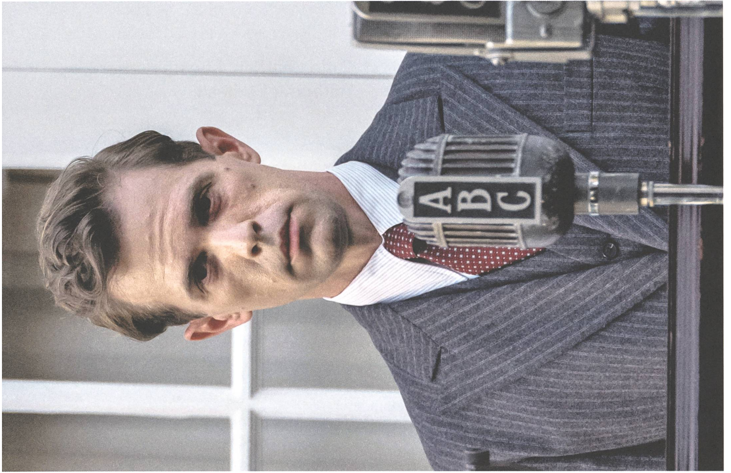
The Plot Against America (2020) von Ed Burns, David Simon