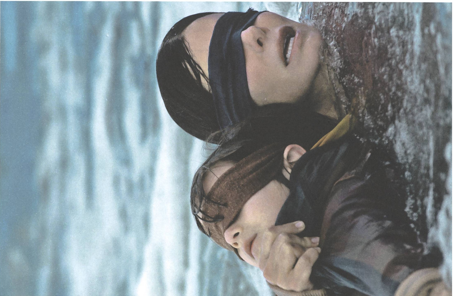
Bird Box (2018) Regie: Susanne Bier