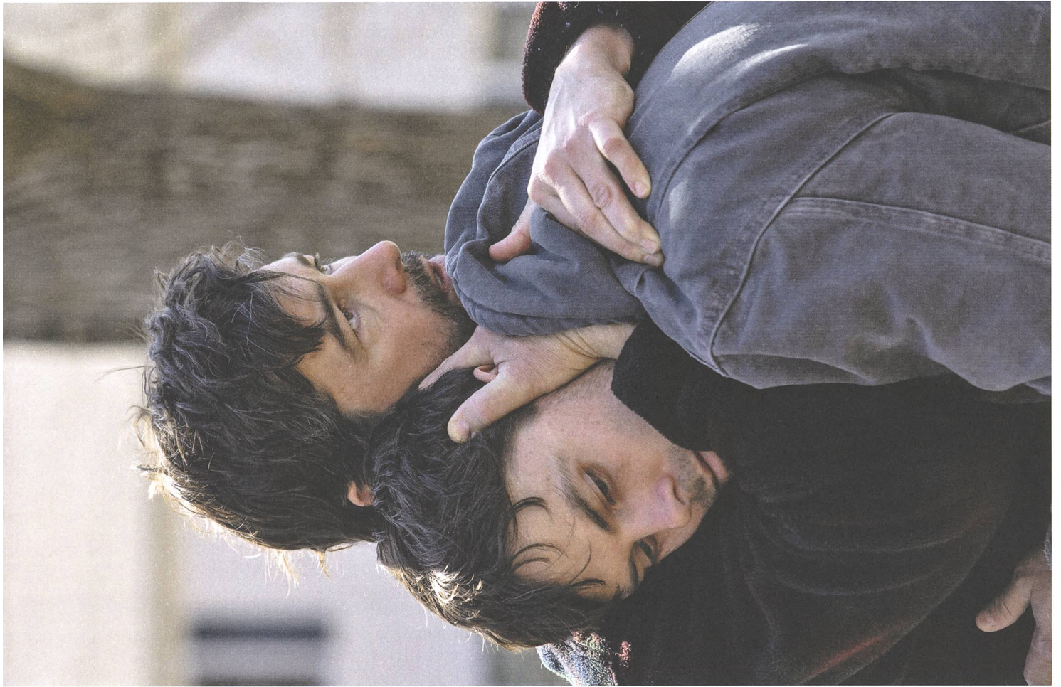
Manchester by the Sea (2016) Regie: Kenneth Lonergan