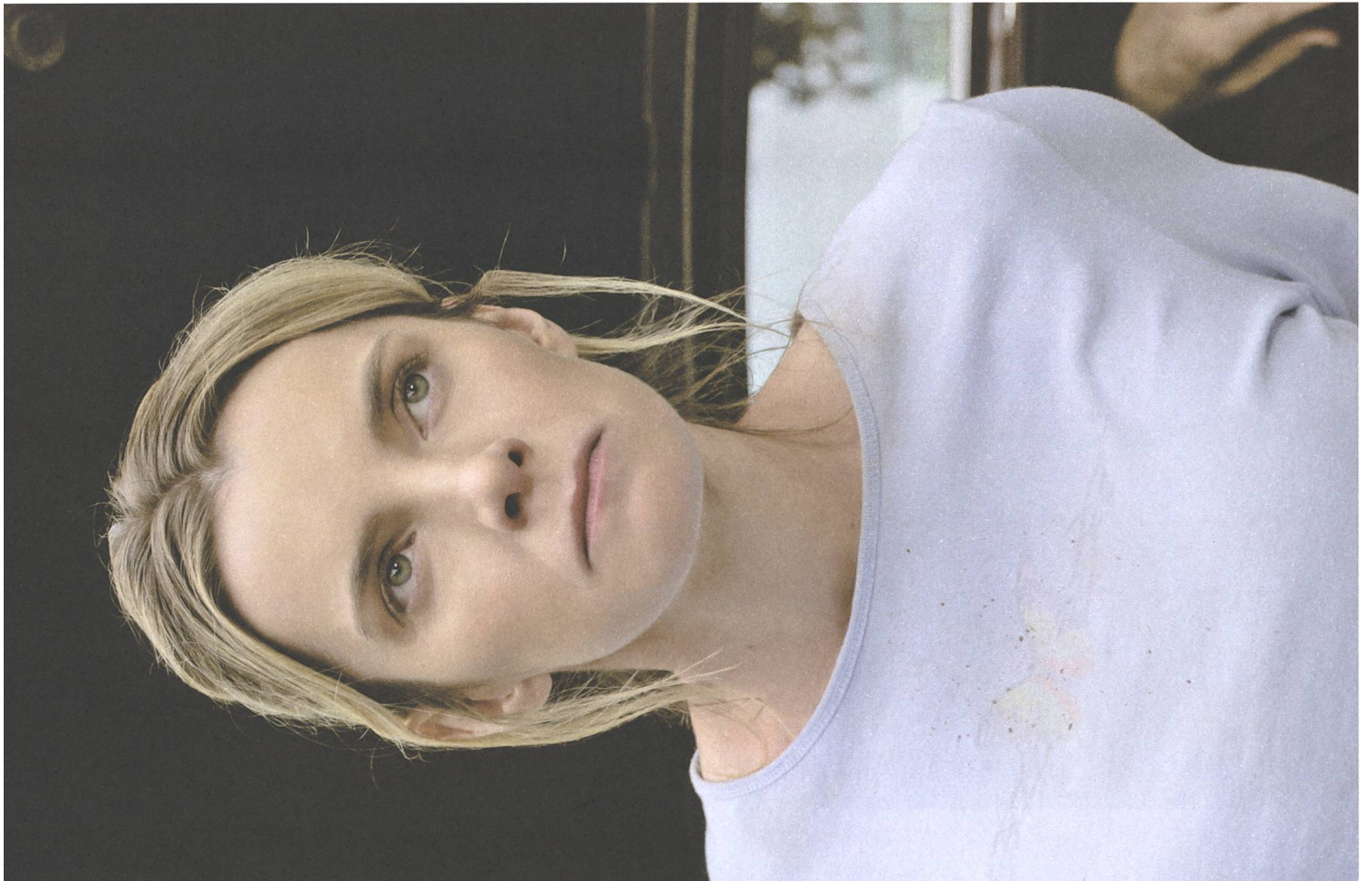
The Hunt (2020) Regie: Craig Zobel