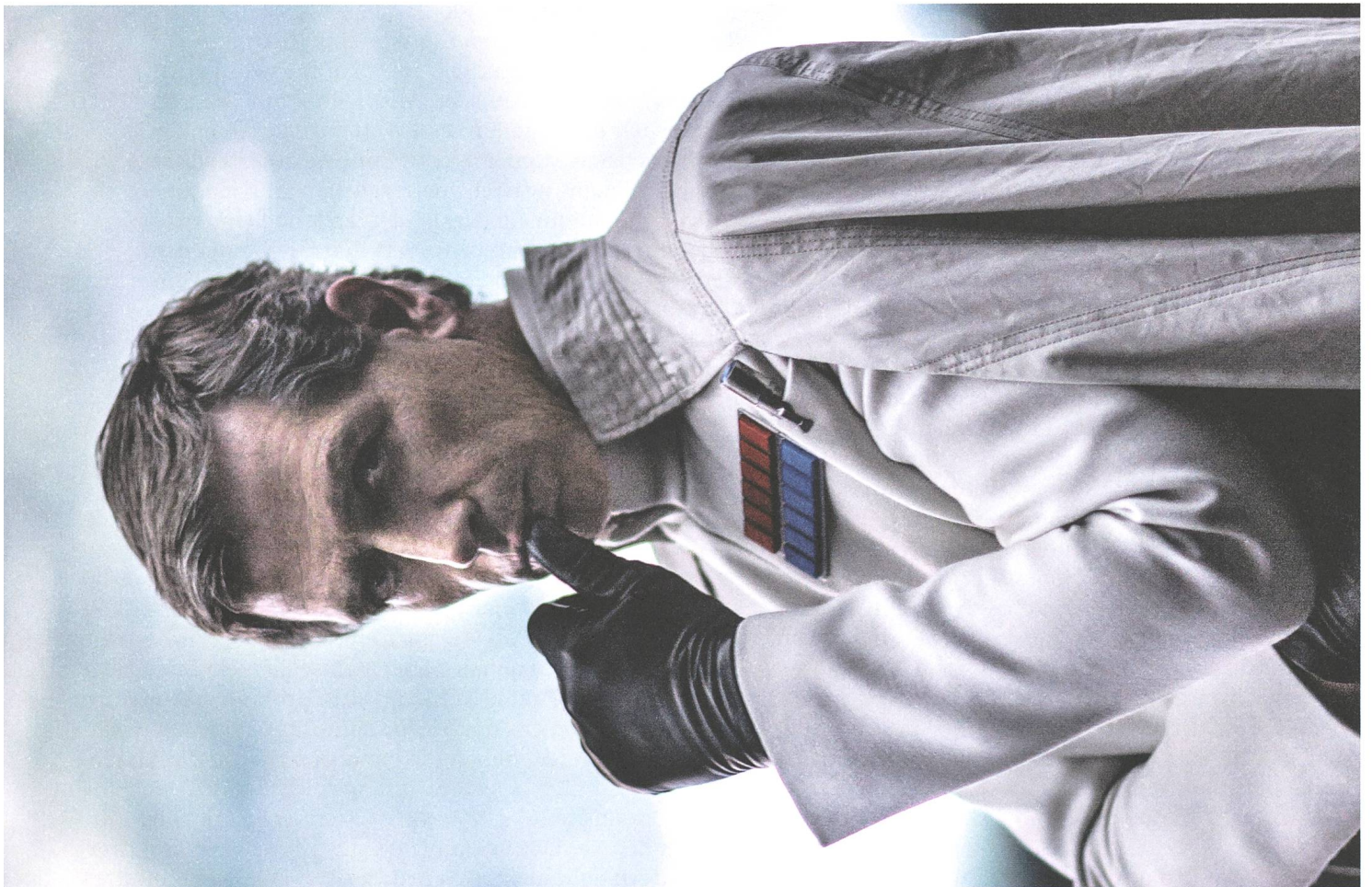
Rogue One (2016) Regie: Gareth Edwards