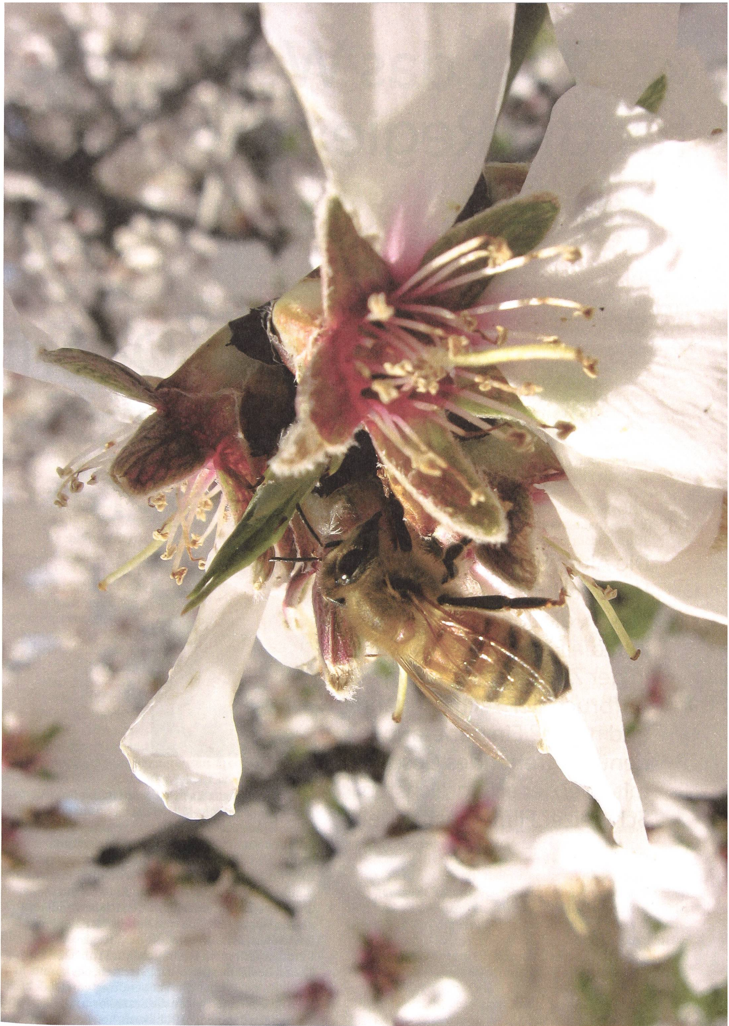
More than Honey (2012) Regie: Markus Imhoof