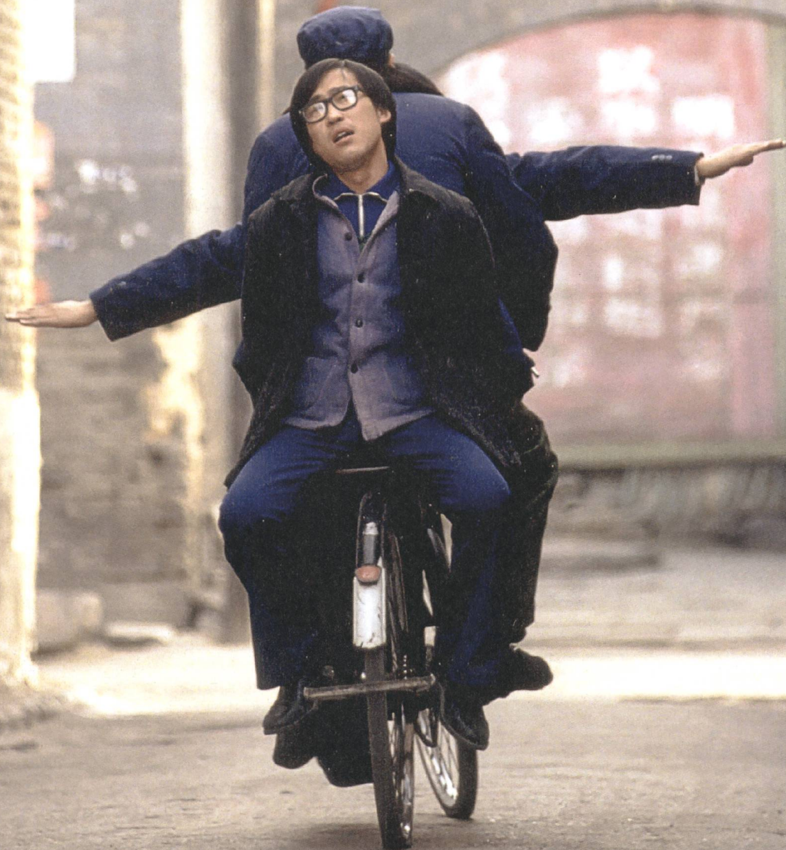
S.47 Platform 2000, Jia Zhangke

Normale «Nobodys» seien die Protagonist*innen in Jia Zhangkes Independentfilmen, schreibt Primo Mazzoni, mit ganz alltäglichen Sorgen. Sie kriegt man im chinesischen Mainstreamkino seltener zu Gesicht.