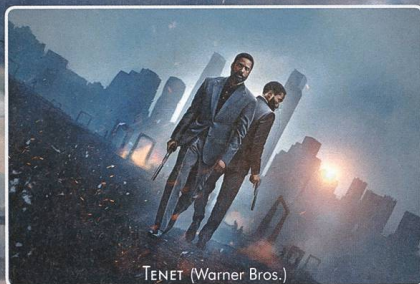
TENET (Warner Bros.)