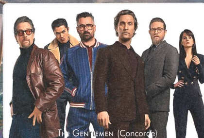
THE GENTLEMEN (Concorde)