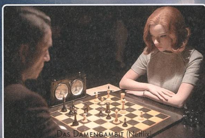
DAS DAMENGAMBIT (Netflix)

Shirin von Abbas Kiarostami (2009).