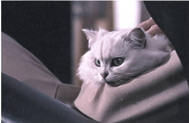
You Only Live Twice 1967, Lewis Gilbert

Wo eigentlich steht James Bond parteipolitisch? Der Staatsbeamte im Smoking, der aufs Elite-Internat Eton ging und am geschüttelten Martini festhält wie Churchill an der dick gerollten Zigarre: Ist das nicht ein dezidiert konservativer Zeitgenosse? Oder fühlt sich so ein promiskuitiver Abenteurer dann doch mehr dem linksliberalen Lager zugehörig? Fest steht: Bond bekämpft das Böse nicht mit einem Parteibuch in der Westentasche. Innenpolitisches Geplänkel geht dem Weltretter ab. Der Agent arbeitet gerne selbstständig, er lässt sich auch von der eigenen Behörde, dem MI6, nicht sagen, wie er den Job zu erledigen hat.