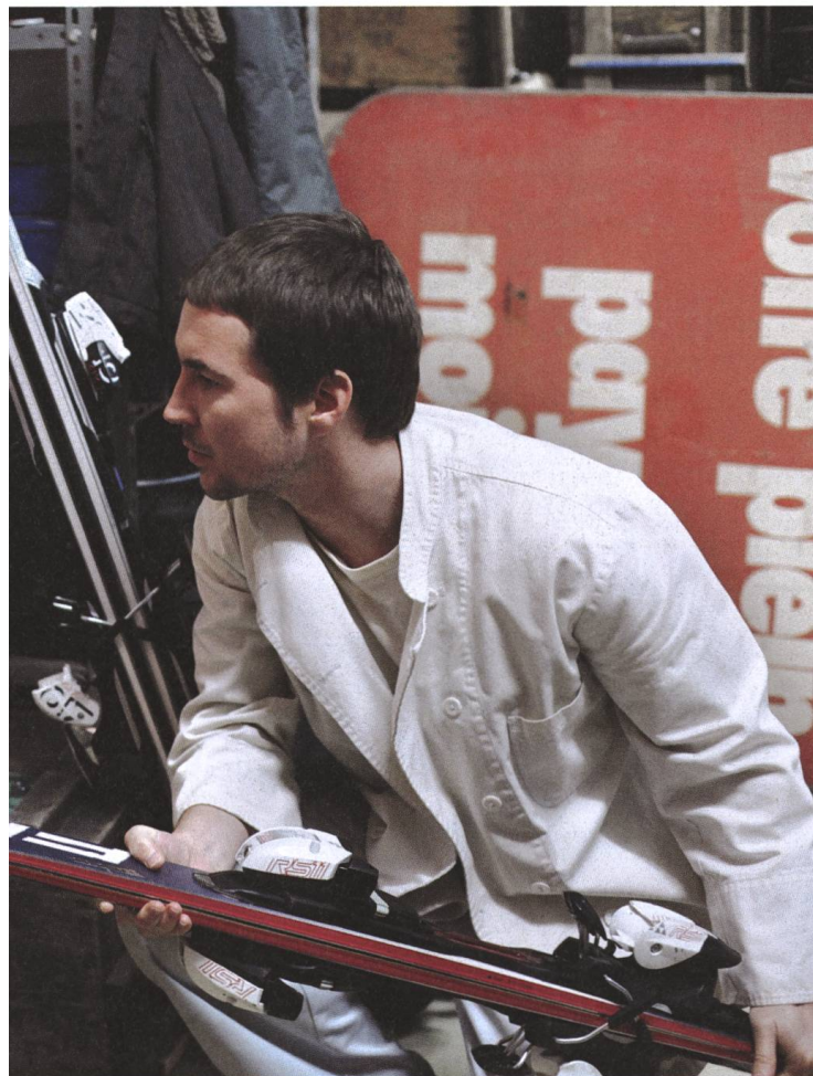
L'enfant d'en haut 2012, Ursula Meier

UM Ich erkenne mich in ihnen wieder und finde das sehr wichtig. Selbst mache ich es auf persönliche, individuelle und intime Weise, weniger öffentlich.