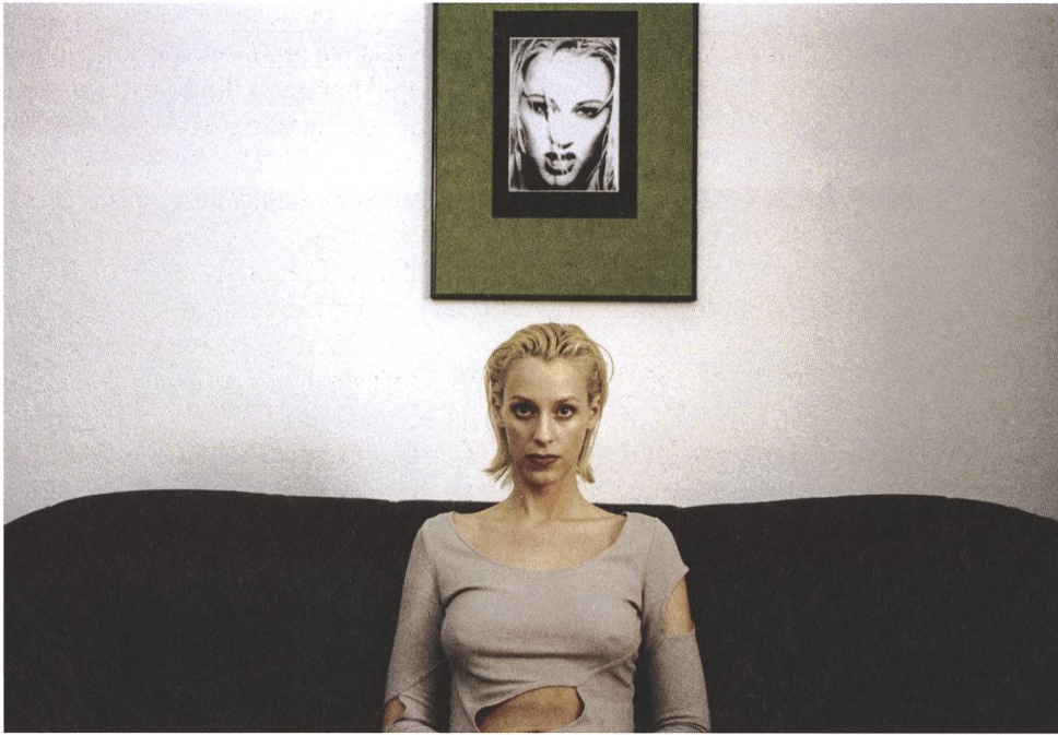
Models 1999, Ulrich Seidl