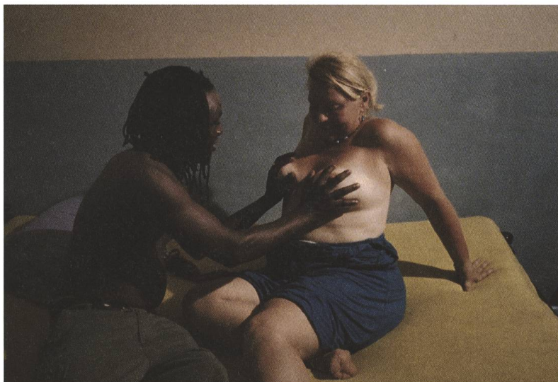
Paradies: Liebe 2012, Ulrich Seidl

«Meine Filme sind nicht nach einer politischen Gesinnung ausgerichtet.»