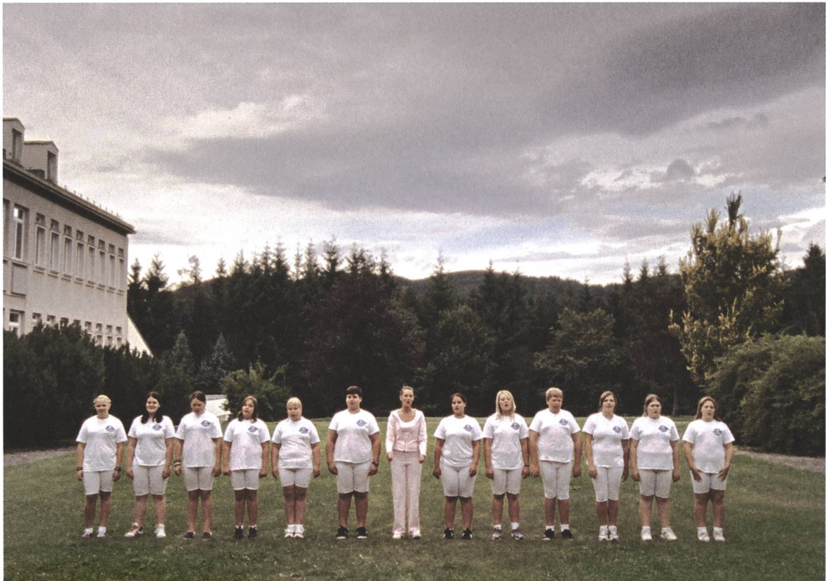
Paradies: Hoffnung 2013, Ulrich Seidl