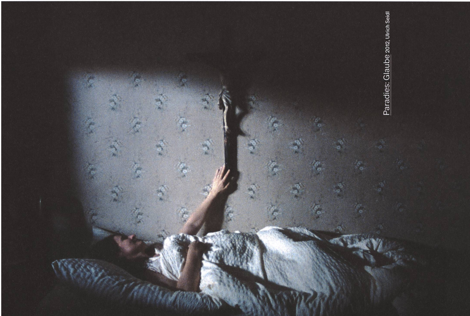
Paradies: Glaube 2012, Ulrich Seidl