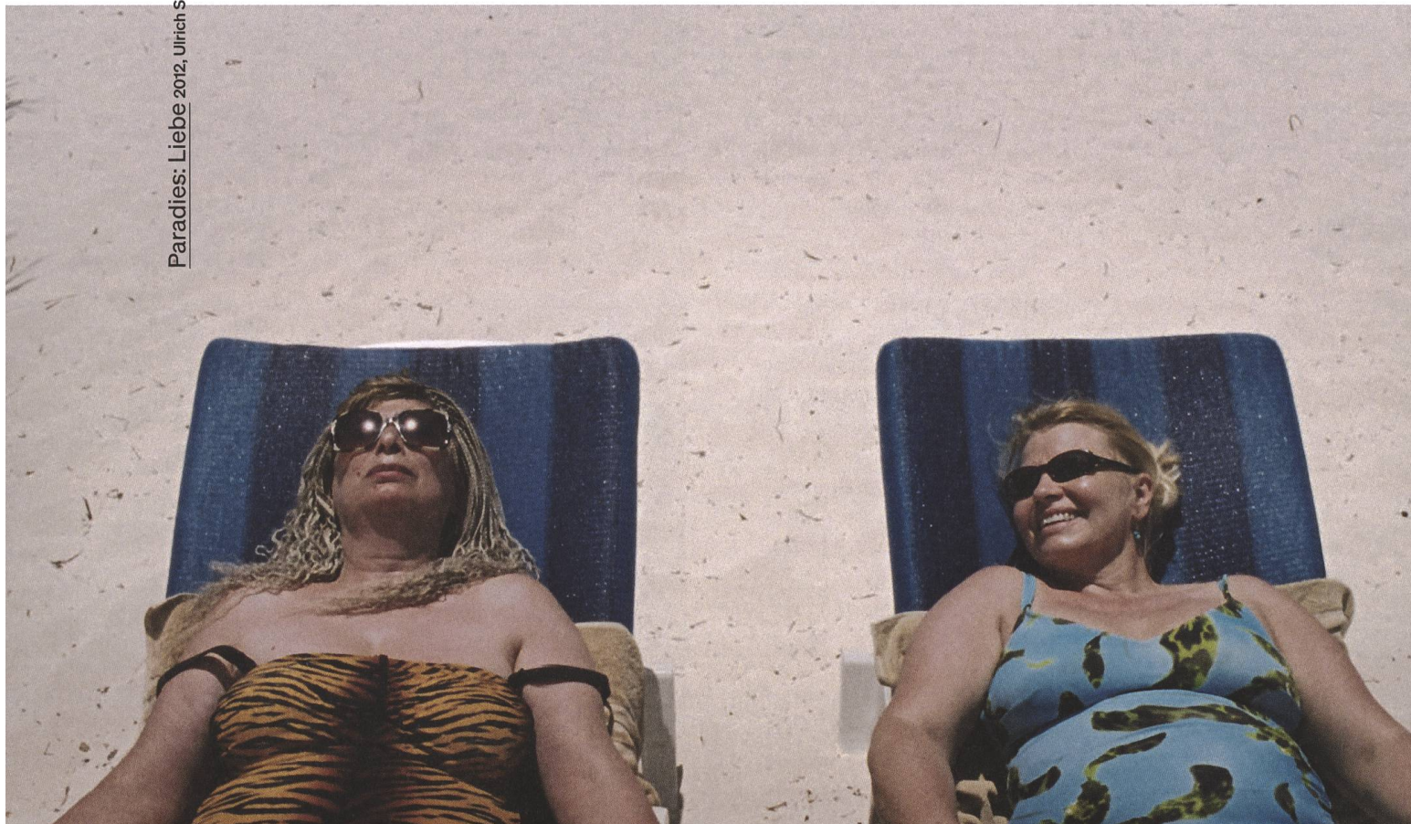
Paradies: Liebe 2012, Ulrich Seidl

US Meine Filme haben keine Message. Und wie Sie richtig sagen, sind meine Filme nicht nach einer politischen Gesinnung ausgerichtet, sondern gesellschaftskritisch. Das ist natürlich auch politisch,