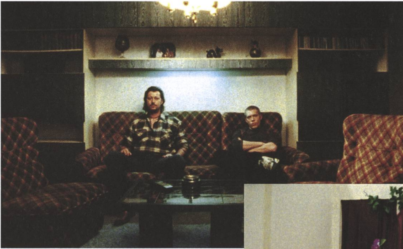
Import Export 2007, Ulrich Seidl