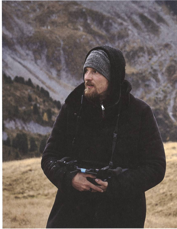
Dreharbeiten zu Luzifer 2021, Peter Brunner