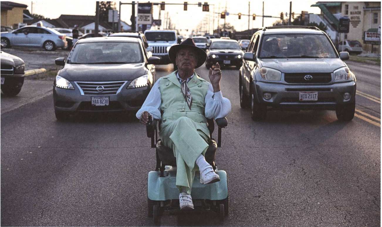
Swan Song 2021, Todd Stephens