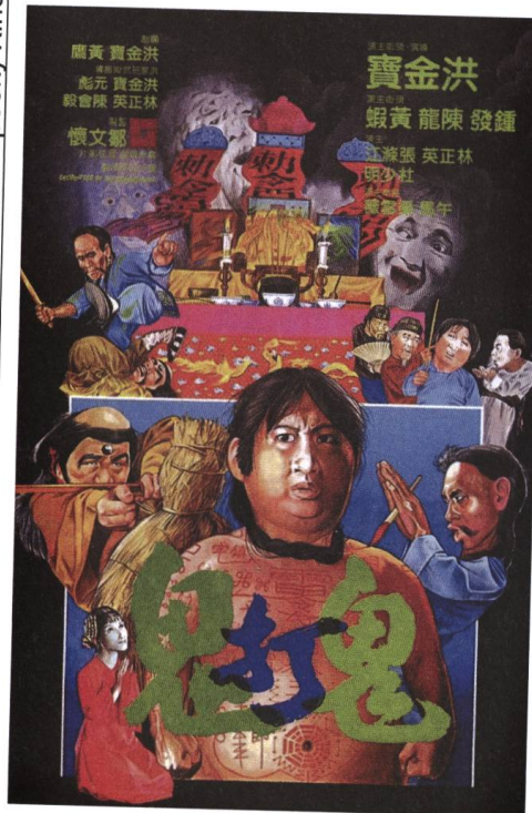
Encounter of the Spooky Kind 1980

figuren den vorbeihumpelnden Hung freundlich grüssen. Yuen Biao taucht ebenfalls auf, als Polizist, der verspricht, da zu sein, falls der demente Ex-Bodyguard seine Erinnerung doch noch wiedererlangen sollte. Noch immer weiss Hung mit Faust und Fuss zu überraschen, noch immer ist der Blick in die Zukunft hoffnungsvoll, noch immer ist er der gütige Aussenseiter, auch wenn sein letzter Film voller Melancholie auf eine Zeit zurückblickt, in der Körper und Kino zu allem fähig schienen. Kaum jemand hat das schöner gezeigt als der grosse Bruder. ■