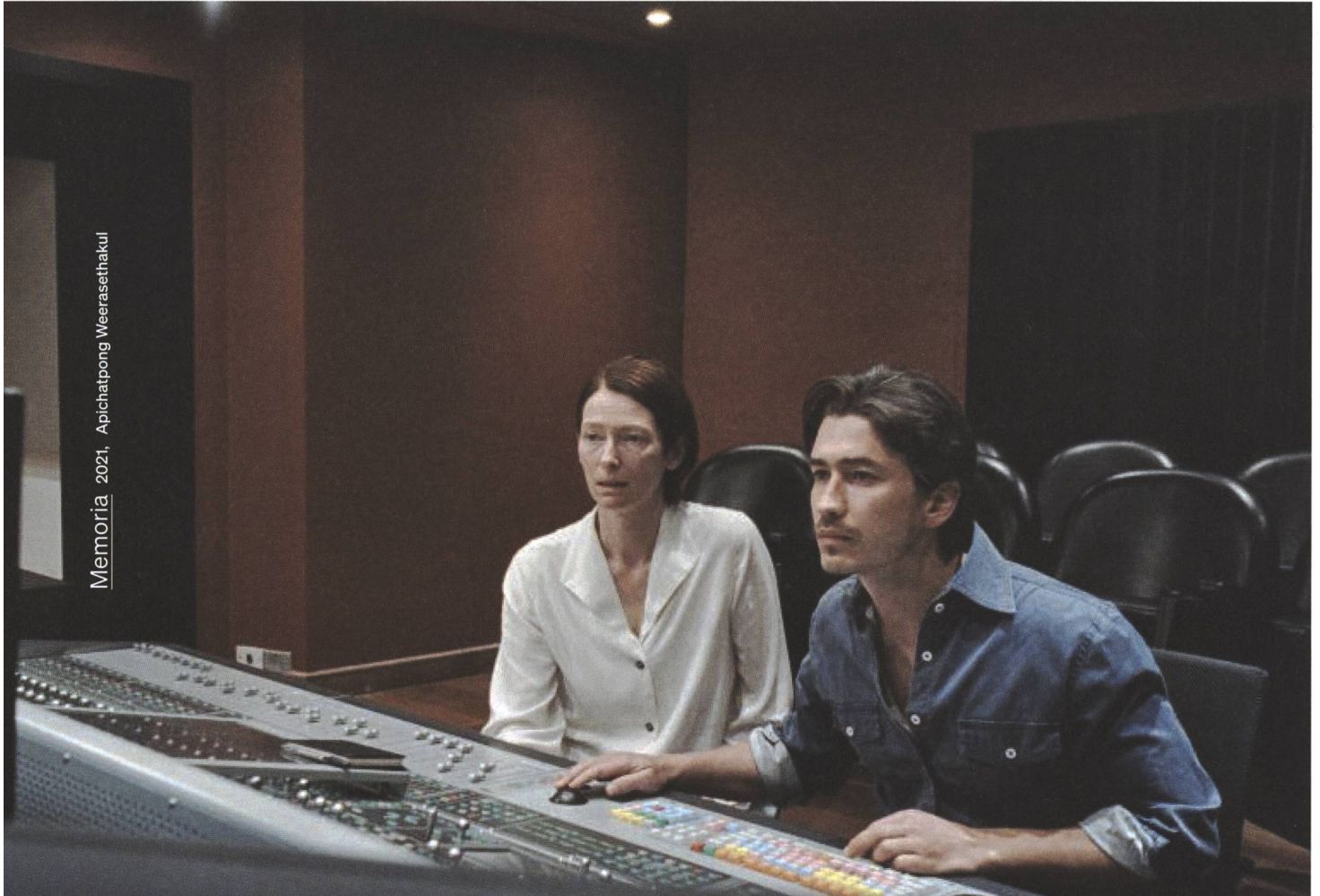
Memoria 2021, Apichatpong Weerasethakul