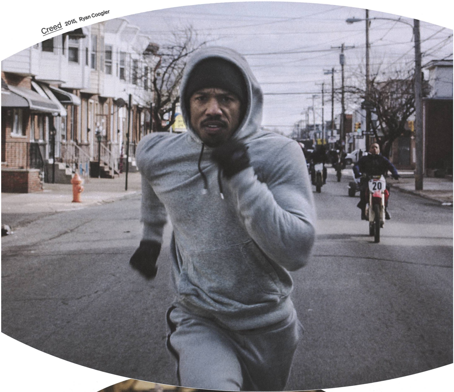
Creed 2015, Ryan Coogler