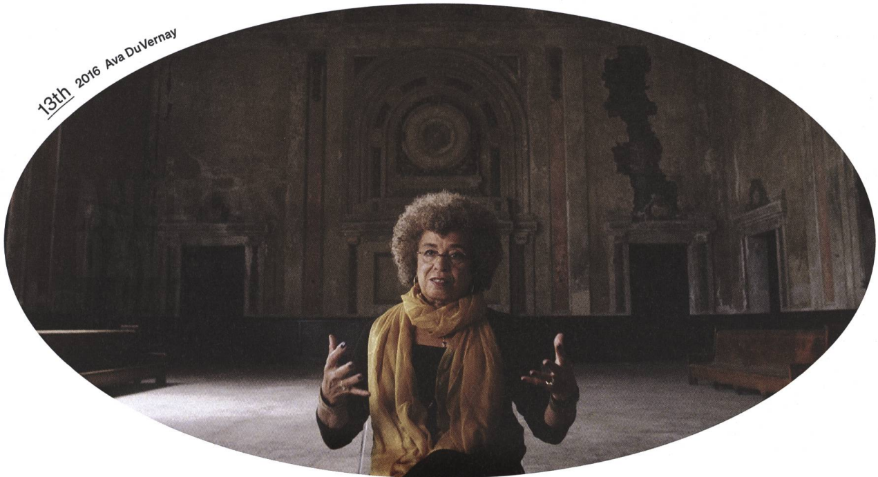
13th 2016 Ava DuVernay

zu den Villen finanzieren. Cooglers nächstes Projekt, die Black-Panther-Fortsetzung , kommt noch dieses Jahr ins Kino. Nachdem der Vorgängerfilm ein Budget von 200 Millionen Dollar hatte und mehr als das Fünffache einspielte, darf man getrost mit noch höheren Kosten und Gewinnen rechnen. Seit knapp zehn Jahren arbeitet Coogler also nur noch an Big-Budget-Hollywood-Franchise-Produktionen. Man fragt sich, wie eine alternative Karriere ausgesehen hätte. Eine, in der er weiterhin kompromisslose Independent-Filme drehen würde, die im Kern den Drang nach sozialer Gerechtigkeit transportieren. Aber wahrscheinlich ist es nur ein weiterer Zufall, dass er von Hollywood in immer höhere Sphären der Fantasie umgeleitet wurde.