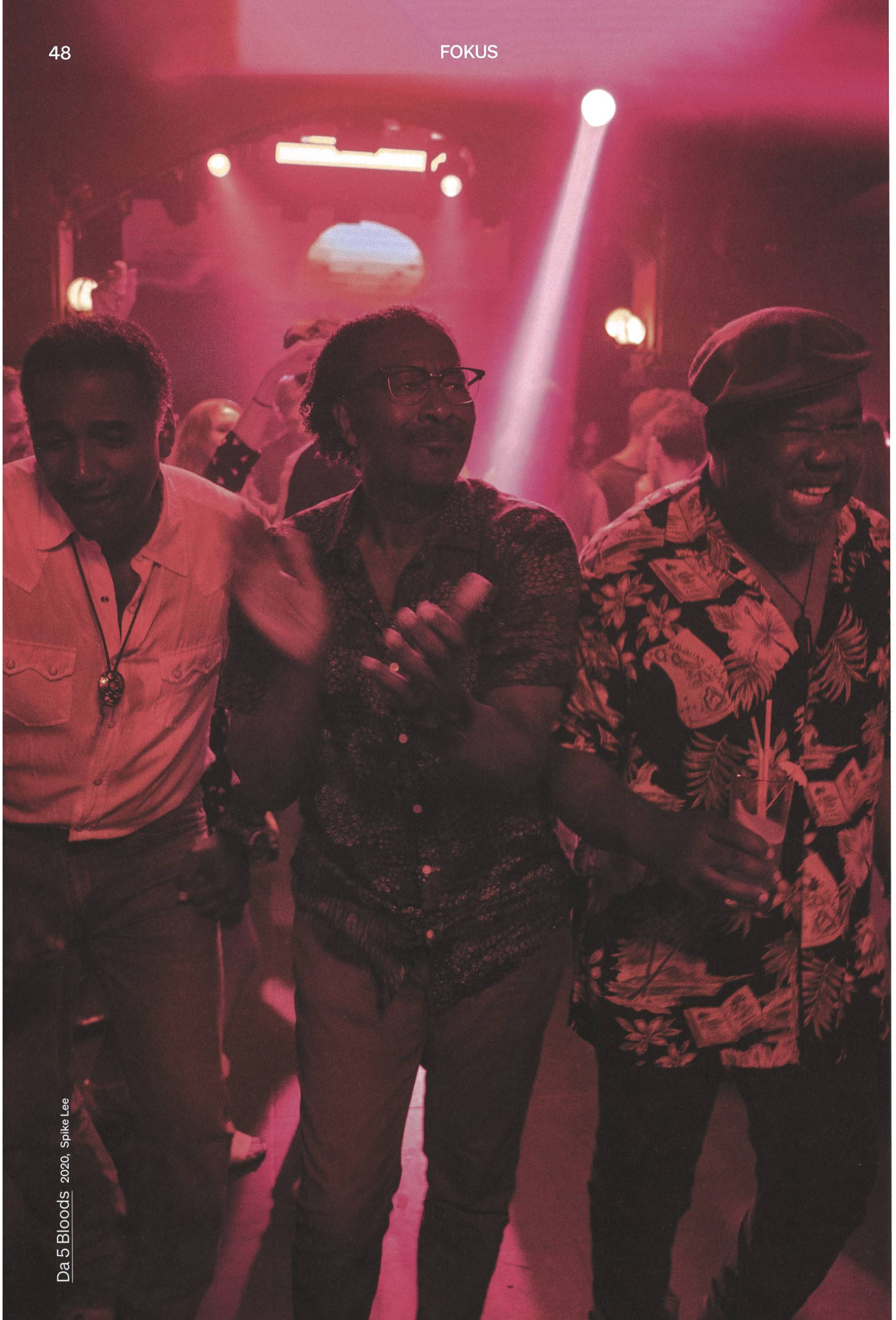
Da 5 Bloods 2020, Spike Lee