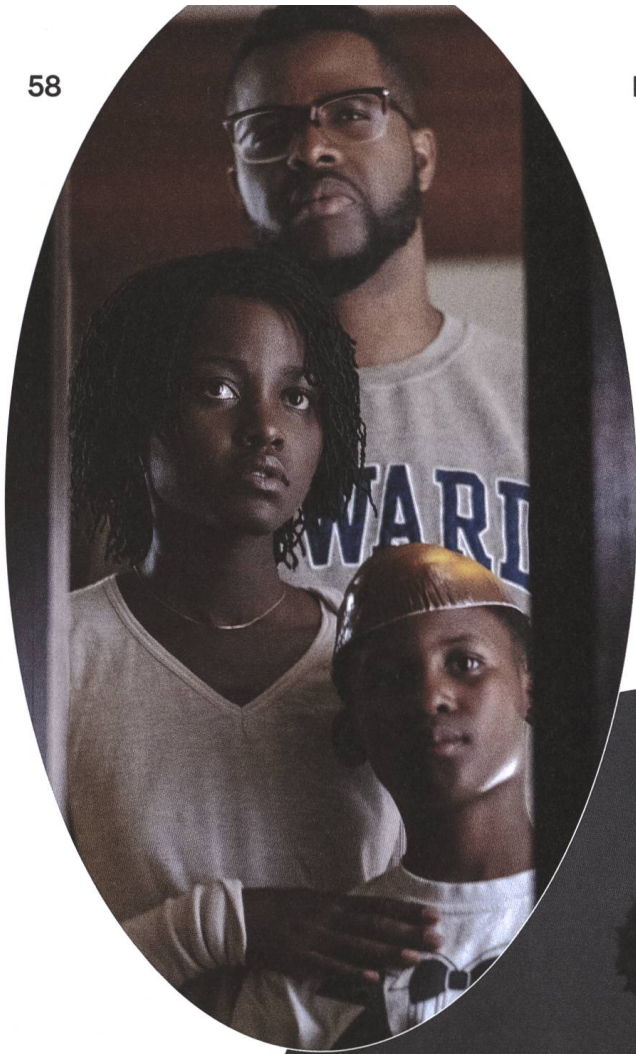
Us 2019, Jordan Peele