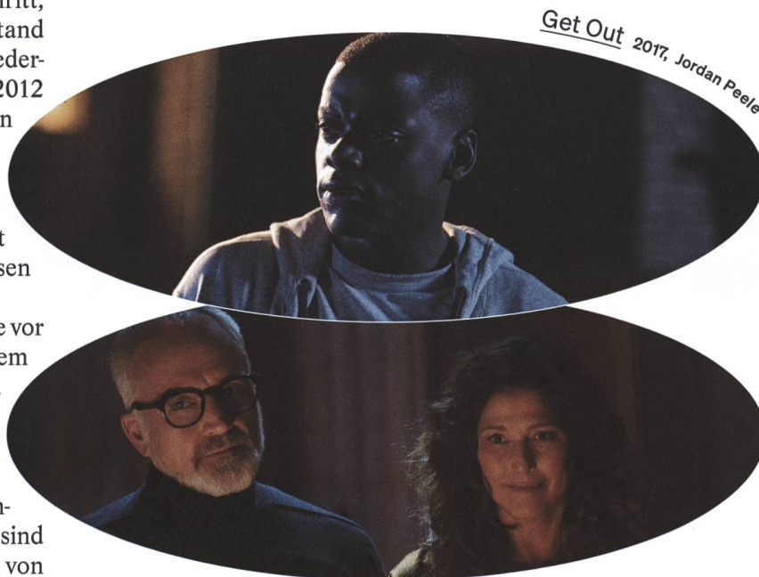
Get Out 2017, Jordan Peele

Get Out ist eine einfache Geschichte, perfekt erzählt. Ein junger Schwarzer Fotograf, Chris (Daniel Kaluuya, der im kommenden Nope wieder mit Peele vereint ist), begleitet seine Weisse Freundin auf das Landgut ihrer Eltern, wo er Opfer des verkommenen Familienunternehmens wird. Ihre Dienstleistung: Entführung und Lobotomie Schwarzer Menschen für die wohlhabende Weisse Kundschaft, die sie dann zerebral bewohnt. Es sei angemerkt, dass der Film sich Zeit nimmt, um diese verblüffende Enthüllung aufzubauen. Bis dahin nimmt das Fleisch an diesem bereits einladenden Knochen allmählich Gestalt an. Ein Beispiel: Der Fernseher – eigentlich der Bildschirm, auf dem Schwarze in der Regel entweder unsichtbar gemacht oder grotesk dargestellt werden – birgt für Chris (und Schwarze