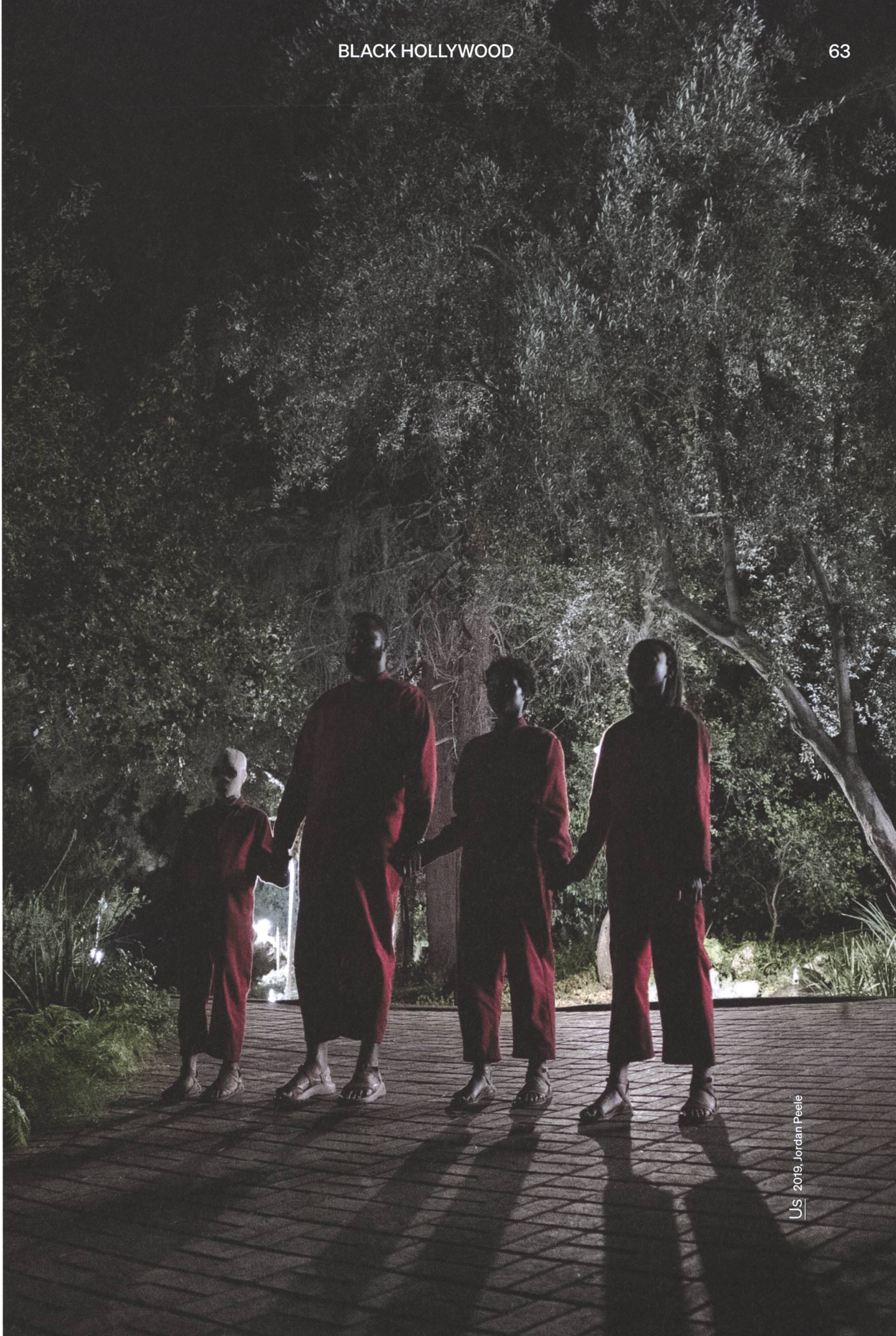
US 2019, Jordan Peele